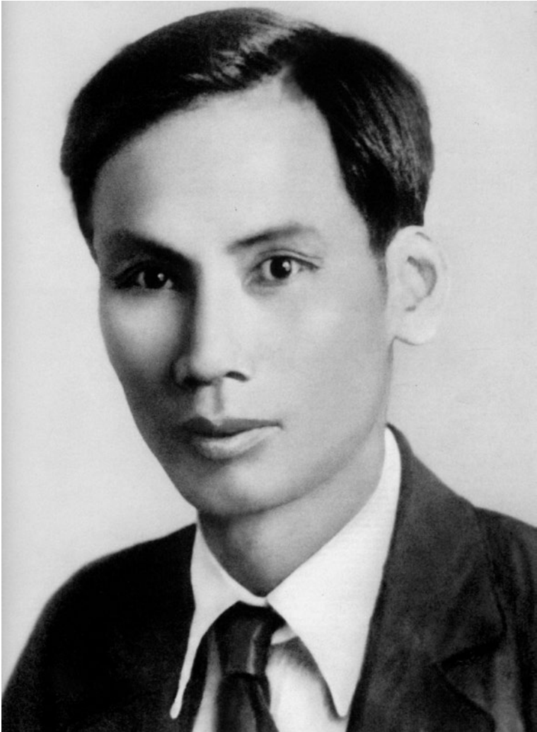
NGUYỄN ÁI QUỐC ở Liên Xô (1923)