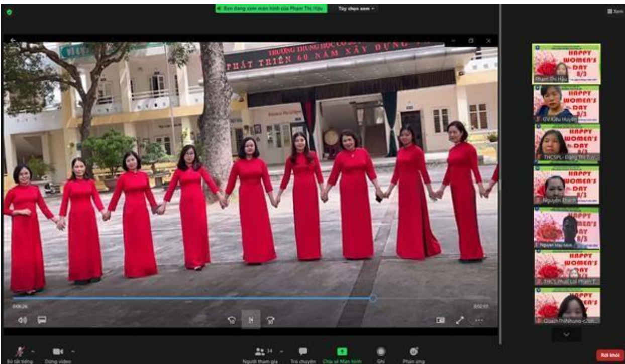
Các cô giáo tổ Khoa học tự nhiên