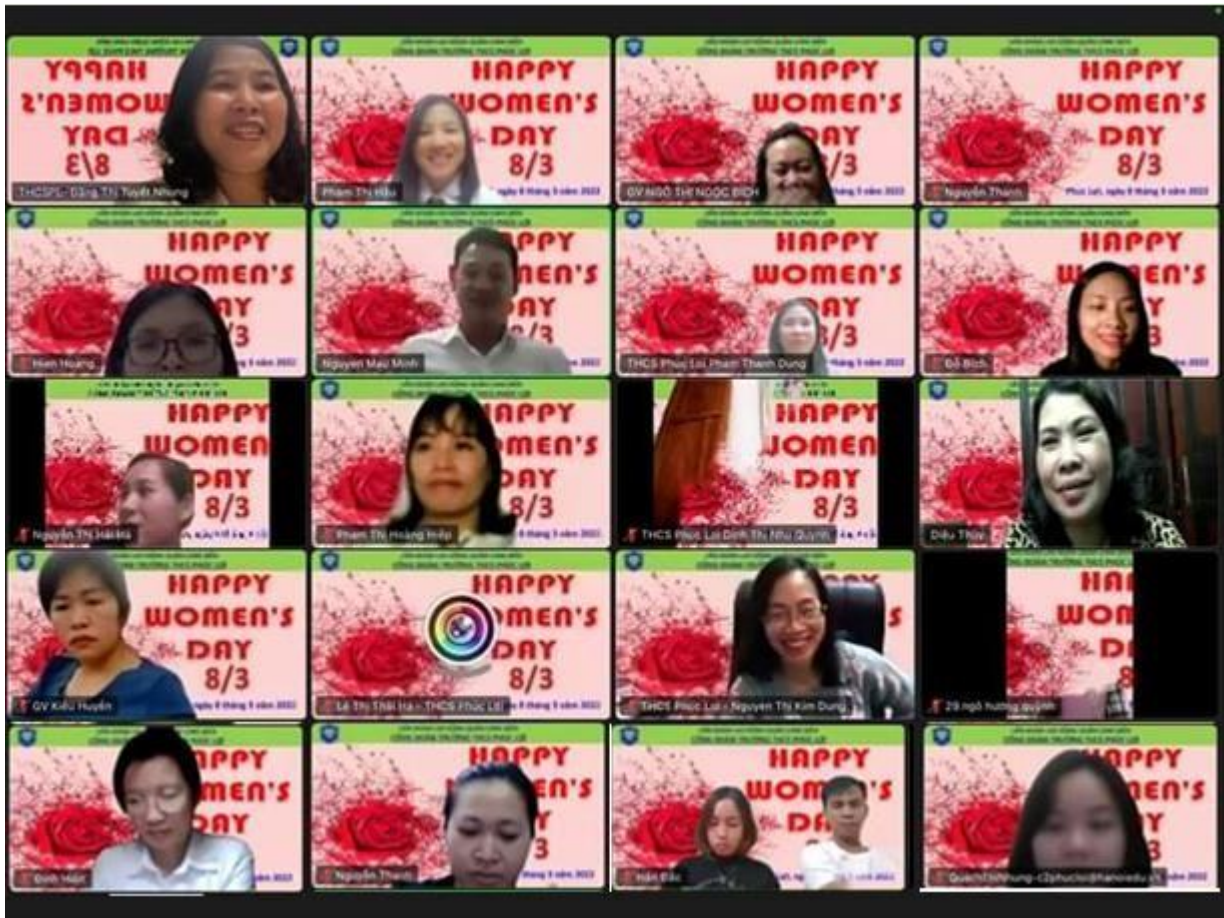
Gặp mặt kỉ niệm 8/3 được tổ chức trực tuyến

Mỗi độ tháng ba về, trong không khí ấm áp của mùa xuân, chúng ta lại hân hoan đón chào kỉ niệm ngày Quốc tế Phụ nữ 8/3. Đó là ngày dành để tôn vinh những vất vả của người mẹ tảo tần, người vợ đảm đang, những người vun vén, dựng xây tổ ấm gia đình. Hòa chung không khí vui tươi của cả nước, tối ngày 7-3-2022, BCH Công đoàn phối hợp cùng nhà trường đã tổ chức buổi gặp mặt kỉ niệm 112 năm Ngày Quốc tế Phụ nữ (8/3/1910-8/3/2022) theo hình thức trực tuyến. Buổi họp mặt được tổ chức trang trọng, ấm cúng với sự tham gia của các thầy, cô giáo trong hội đồng sư phạm nhà trường.