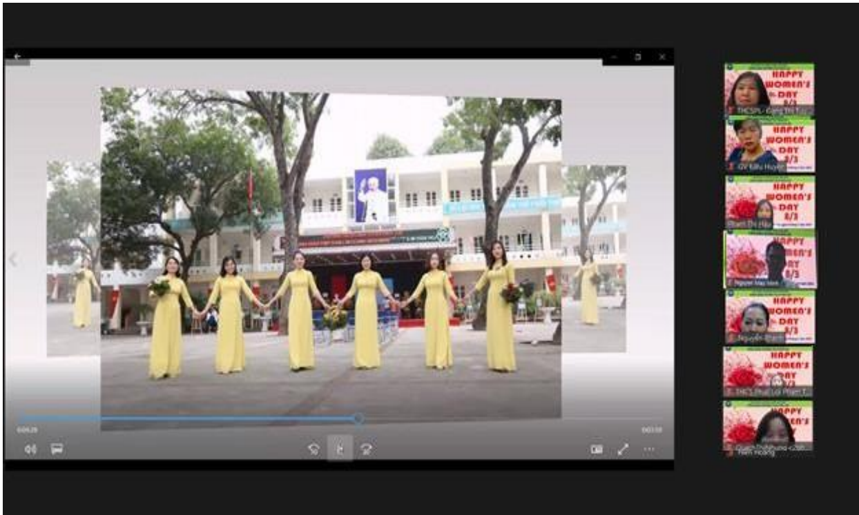
Các cô giáo tổ Văn phòng