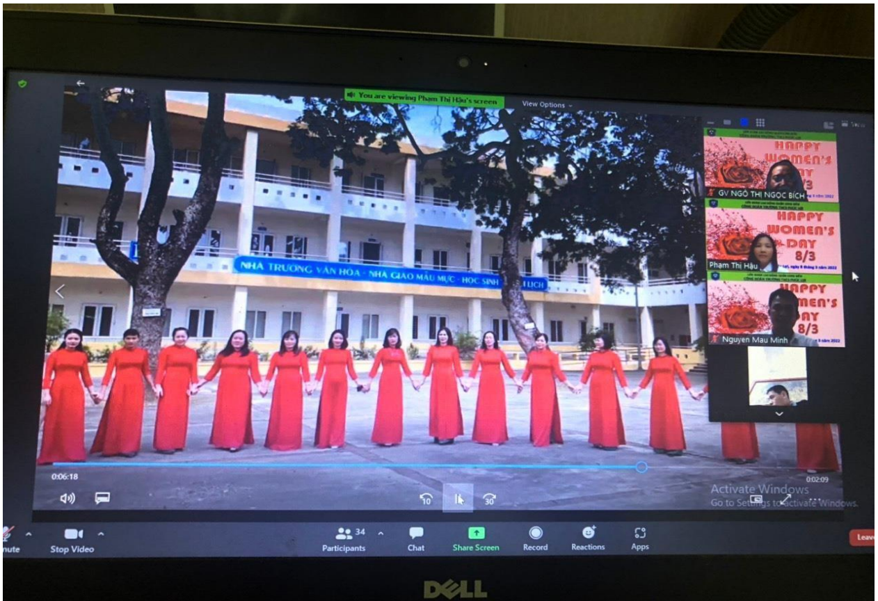
Các cô giáo tổ Khoa học xã hội