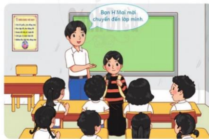
Tình huống 2

A: Gần gũi, nói chuyện với bạn để bạn hoà nhập với cả lớp.