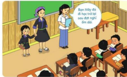
Tình huống 1