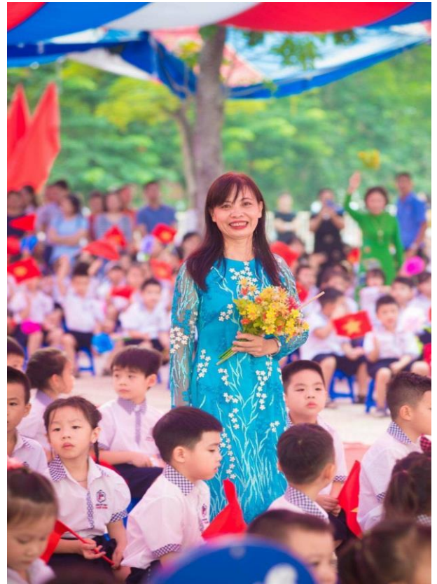
Cô Liễu bên học trò thân yêu