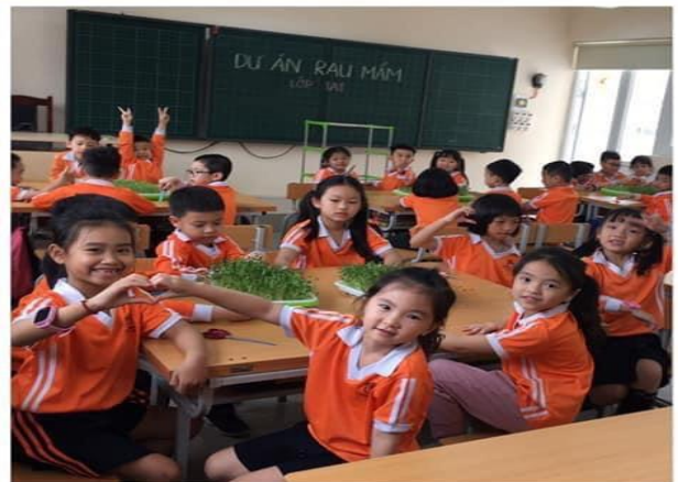
Mỗi giờ lên lớp luôn là những tiết học thú vị