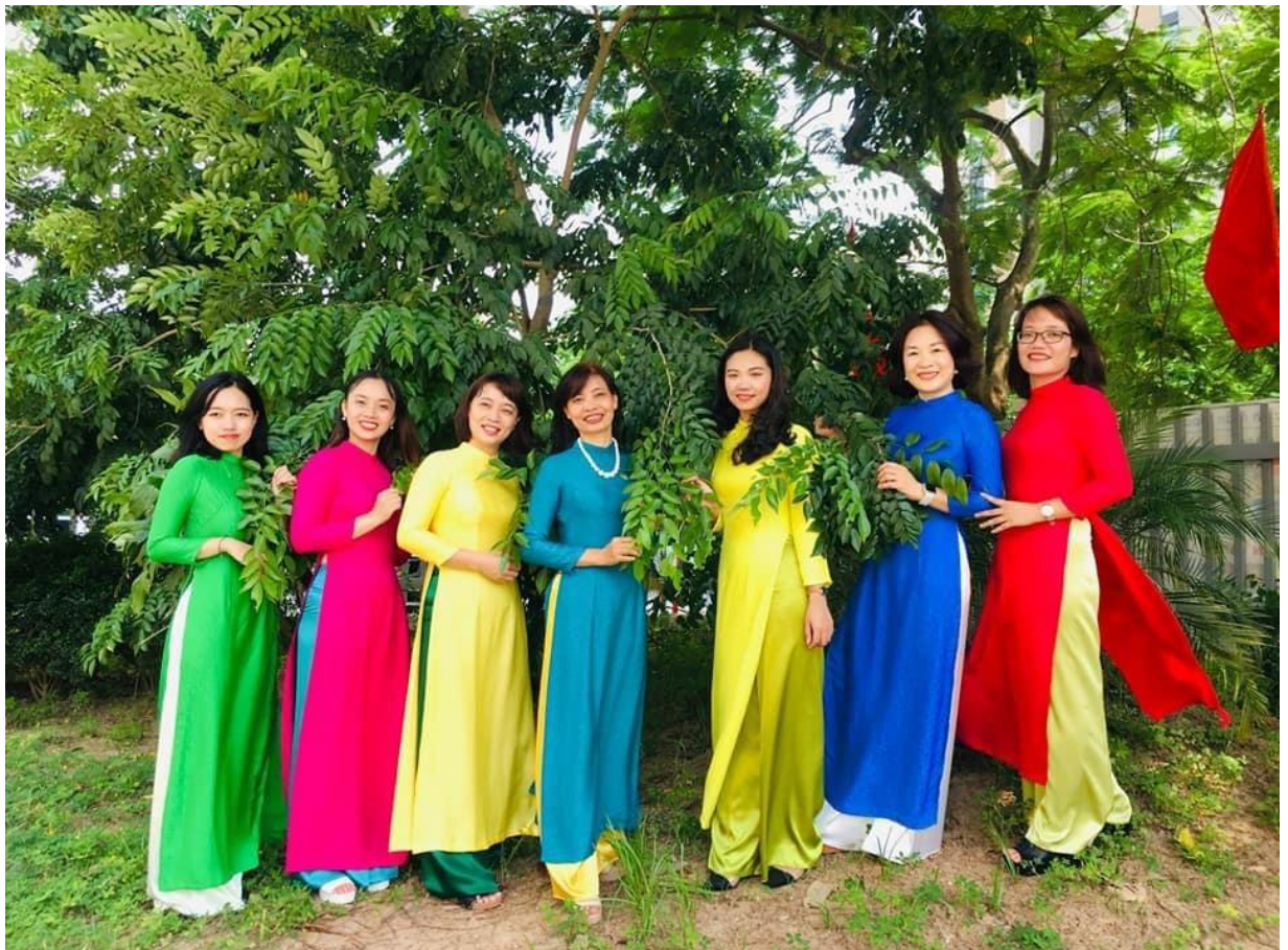
Cô Liễu bên đồng nghiệp tổ 1