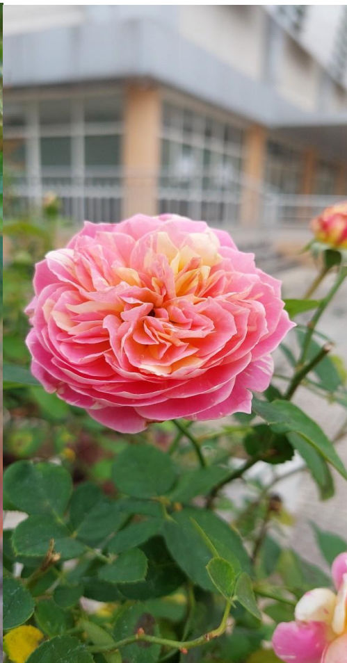
Những bông hoa do cô Liễu tự tay trồng