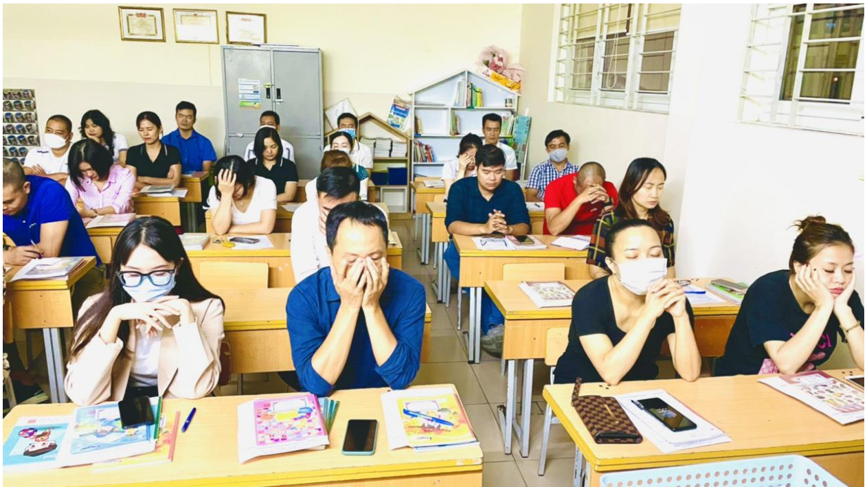
Phụ huynh cùng nhau tham gia trải nghiệm trong buổi họp.

Điều lắng đọng nhất trong lòng tôi là khi được cảm nhận thanh âm ấm áp của bài thiền ca “Khơi nguồn yêu thương” và khi ngòi cầm bút viết thư cho cậu con trai bé bỏng của mình.