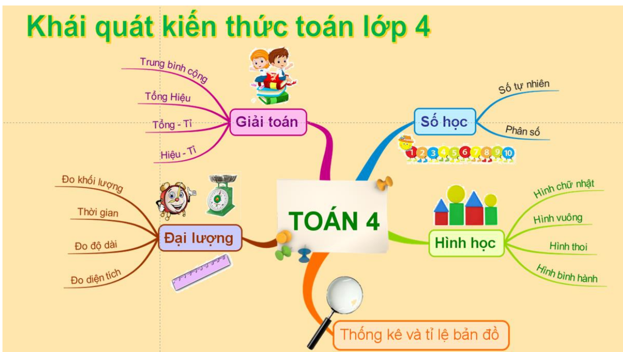
Khái quát kiến thức môn Toán lớp 4

Chưa dừng lại ở đó, tôi đã vô cùng ngạc nhiên khi một cô giáo sắp bước vào tuổi 50 lại có thể ứng dụng công nghệ thông tin một cách thành thục, tinh tế như vậy khi trình bày báo cáo kết quả năm học trước, phương hướng, nhiệm vụ năm học này của nhà trường và khái quát nội dung học tập của các con. Chính điều đó đã giúp cho chúng tôi trả lời được các câu hỏi liên quan đến nhà trường, nắm bắt được tổng thể nội dung học tập của các con mà không cảm thấy nhàm chán. Tôi lại càng yên tâm vì con mình sẽ được tiếp cận nhiều kiến thức mới bằng phương pháp mới, đầy hứng khởi và đam mê.