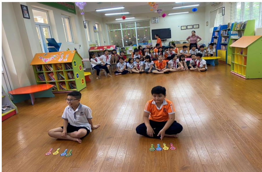
Quán quân và Á quân của khối 4