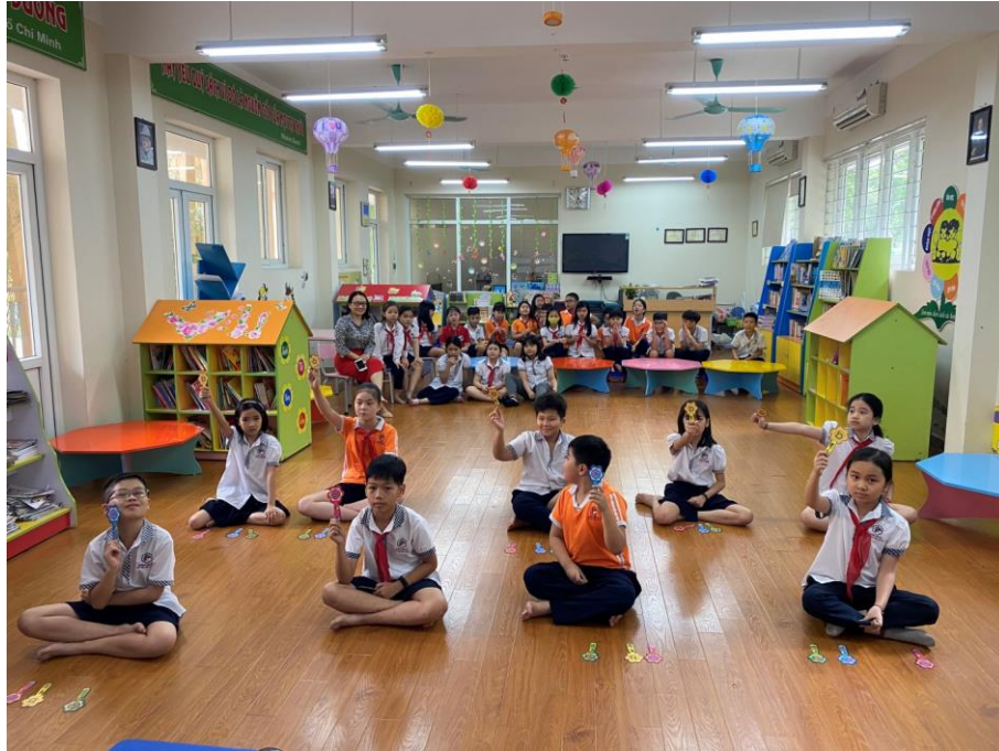
Các bạn xuất sắc bước vào vòng 3

đúng câu hỏi cuối cùng và rung lên hồi chuông chiến thắng trong sự cổ vũ nhiệt tình của các bạn cổ động viên. Với câu hỏi cần vận dụng những hiểu biết tích lũy qua những bài học trên lớp, những trải nghiệm trong cuộc sống hàng ngày, quán quân của khối 4 đã tự tin vượt qua 4 vòng thi với sự thán phục của các bạn học sinh.