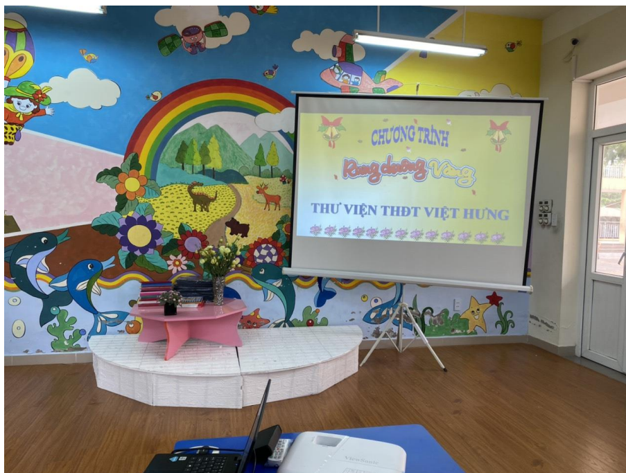
Cuộc thi Rung chuông vàng cùng thư viện