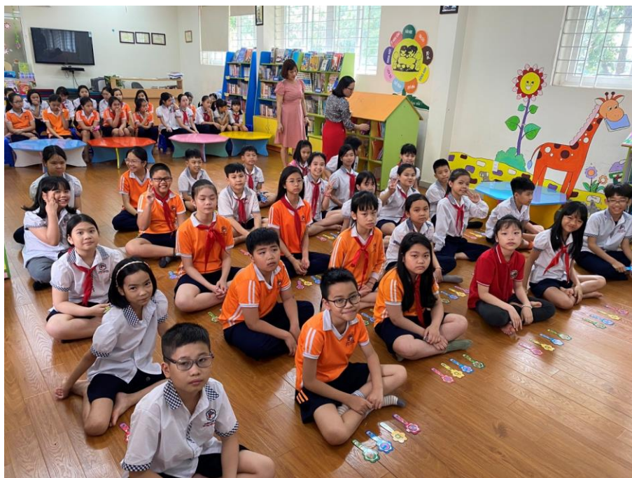
Các bạn học sinh khối 4 hào hứng với cuộc thi

Vòng 1 gồm 11 câu hỏi ở dạng trắc nghiệm cơ bản tăng dần độ khó để tìm ra những thí sinh xuất sắc ở lại sàn thi đấu. Với những câu hỏi như: Chuột túi là biểu tượng của quốc gia nào? Châu lục lớn và đông dân nhất trên Trái Đất là châu lục