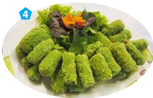
Chả giò cốm xanh