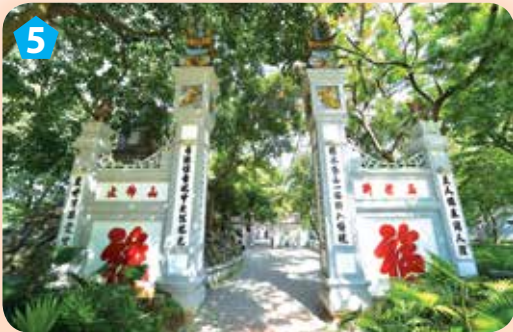
Đền Ngọc Sơn