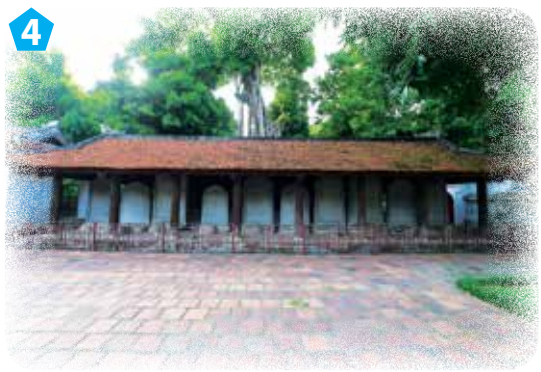
Nhà bia tiến sĩ