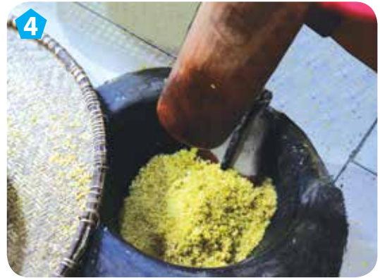
4 Giã thóc bằng cối đá và chày gỗ