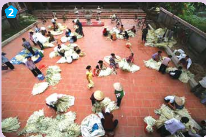
Sân đình làng Chuông

Làng Chuông ở huyện Thanh Oai, thành phố Hà Nội. Làng có nghề làm nón lá lâu đời và nổi tiếng khắp vùng.