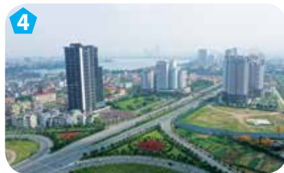
Đường Võ Chí Công, quận Tây Hồ