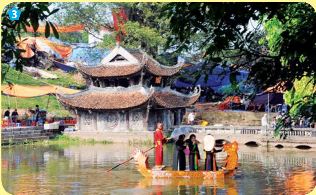
Hát quan họ trước cửa đền Phù Đổng, huyện Gia Lâm

Ngoài hội Gióng ở đền Phù Đổng, hội Gióng còn được tổ chức ở nhiều nơi trên địa bàn thành phố Hà Nội.