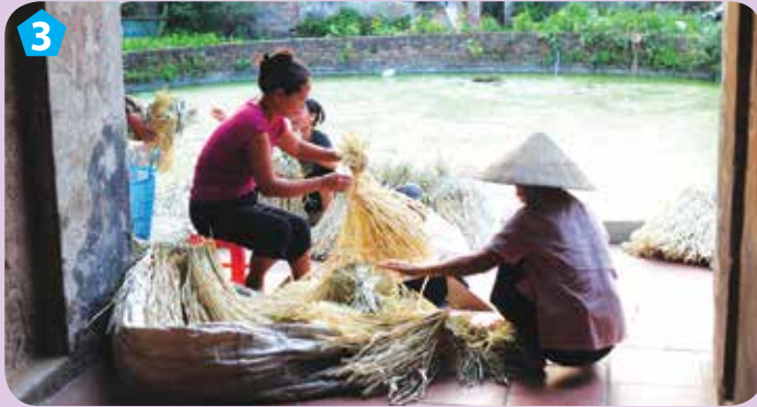
Chuẩn bị nguyên liệu làm nón ở làng Chuông