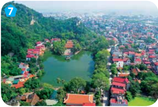
7 Chùa Thầy, huyện Quốc Oai