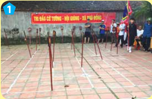
Chơi cờ tướng