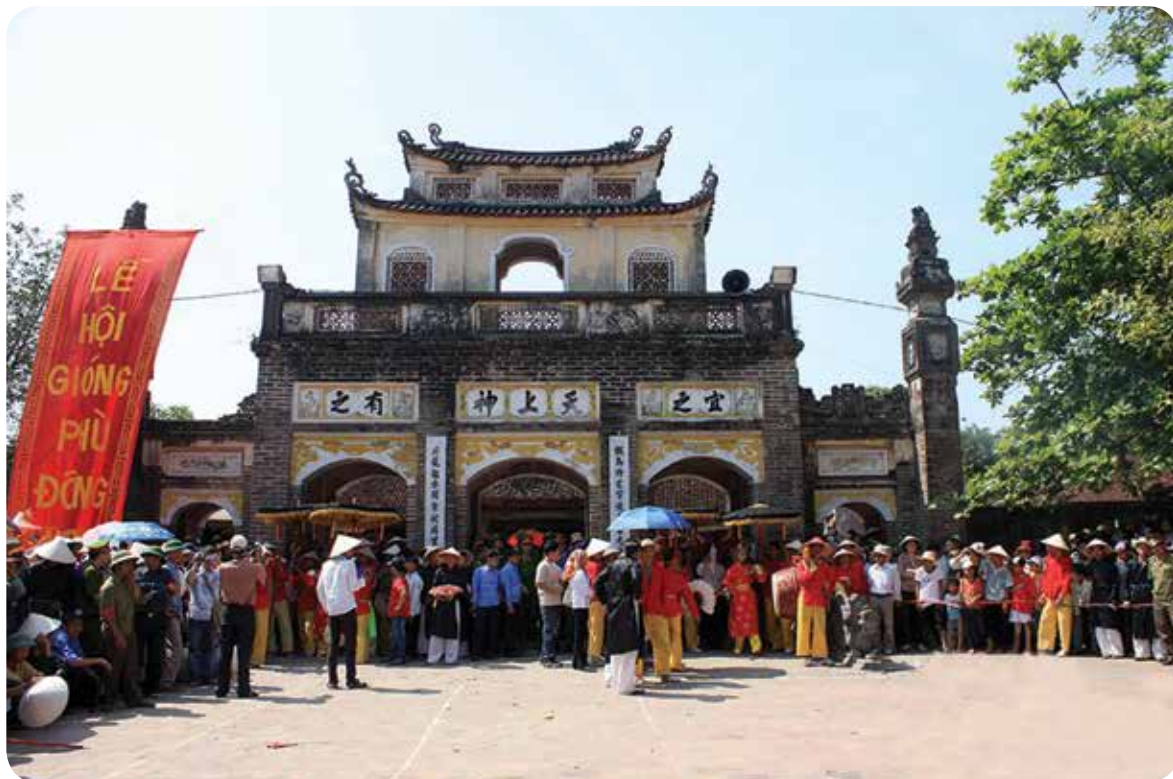
Quang cảnh hội Gióng ở đền Phù Đổng, huyện Gia Lâm