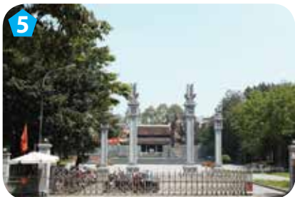
Di tích Gò Đống Đa, quận Đống Đa