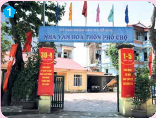
Nhà văn hoá