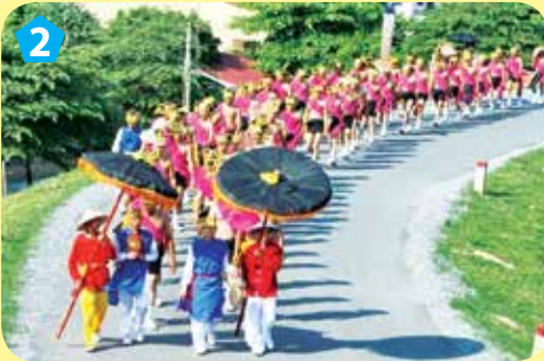
Lễ rước tái hiện đội quân Thánh Gióng

* Cô Tướng: mỗi Cô Tướng là đại diện một đạo quân giặc Ân. 28 Cô Tướng là 28 đạo quân.