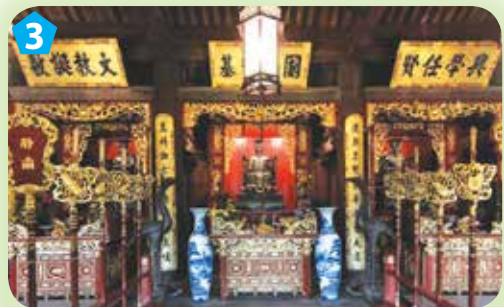
Ban thờ ba vị vua: Lý Thánh Tông, Lý Nhân Tông và Lê Thánh Tông