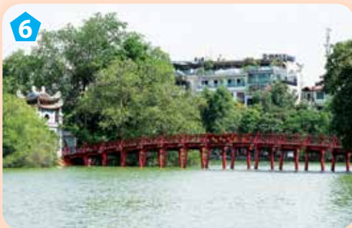
Cầu Thê Húc