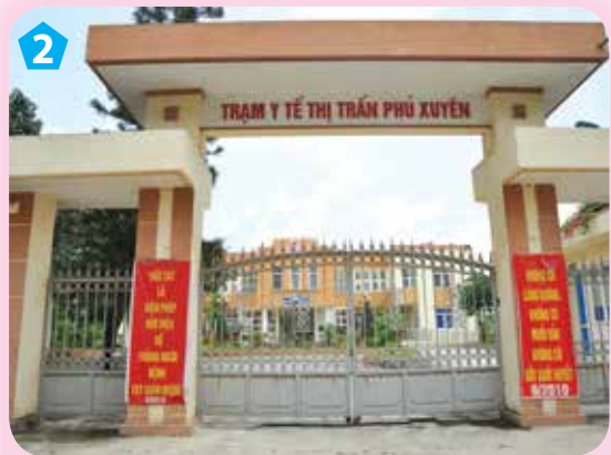
Trạm y tế