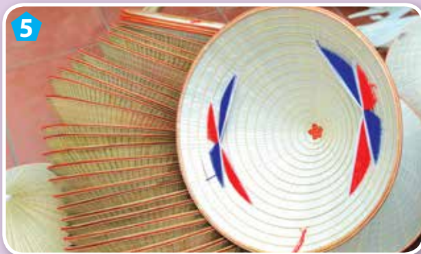
Nón lá làng Chuông

Muốn ăn cơm trắng cá trê Muốn đội nón tốt thì về làng Chuông.