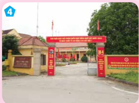
Trụ sở Ủy ban Nhân dân xã