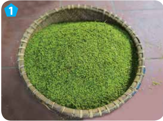
1 Chọn lúa nếp hoa vàng, non vừa phải