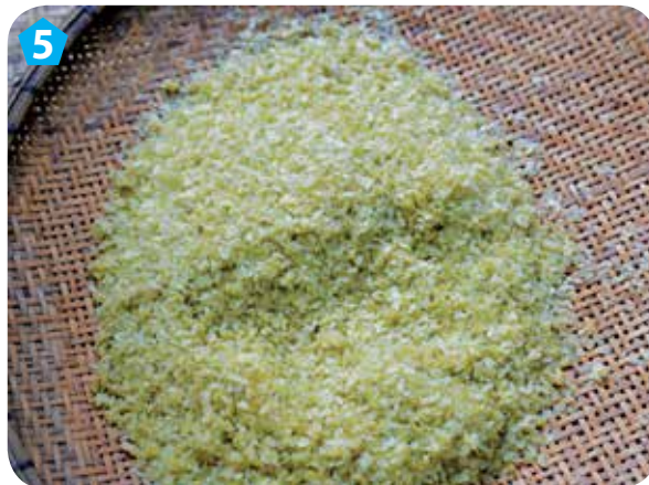
5 Thu hoạch được hạt cốm sau khi hoàn thành công đoạn giã thóc.