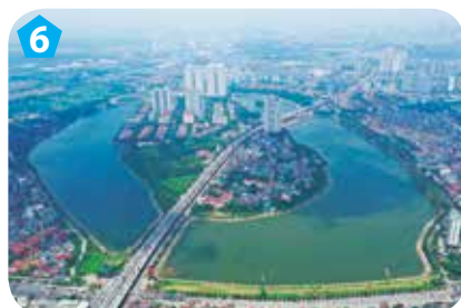
Bán đảo Linh đàm, quận Hoàng Mai