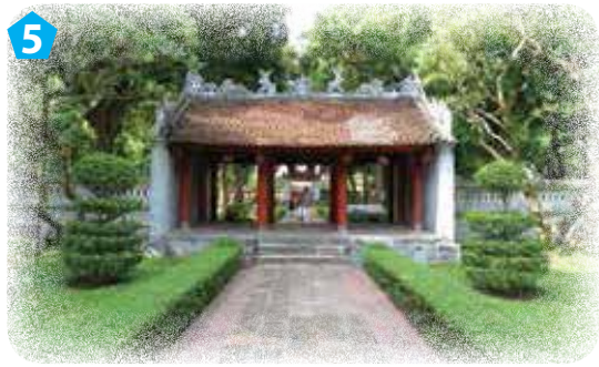
Cổng đại trung