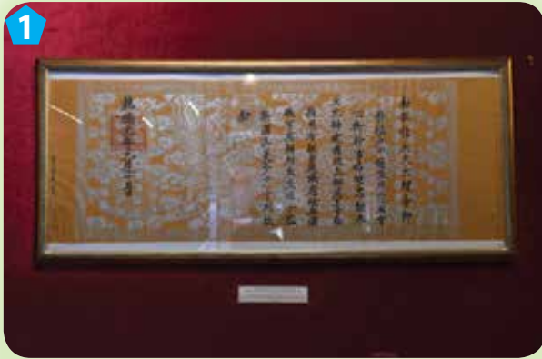
Sắc phong tiến sĩ

2. Kể tên một số hiện vật trong khu di tích Văn Miếu - Quốc Tử Giám qua các bức ảnh sau: