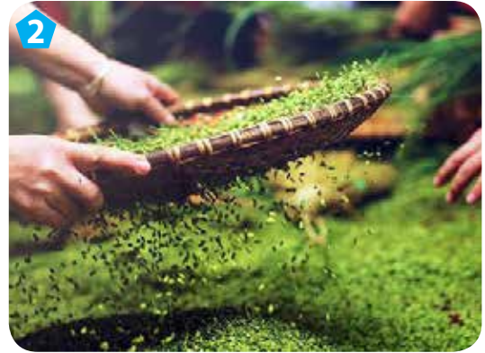
2 Sàng để loại bỏ thóc lép