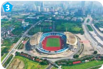
Sân vận động Mỹ Đình, quận Nam Từ Liêm