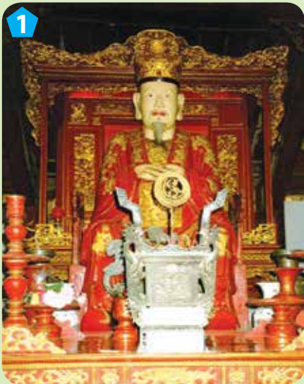
Ban thờ Khổng Tử

3. Kể tên một số nhân vật lịch sử được thờ trong khu di tích Văn Miếu - Quốc Tử Giám qua các bức ảnh sau: