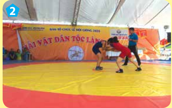
Thi đấu vật