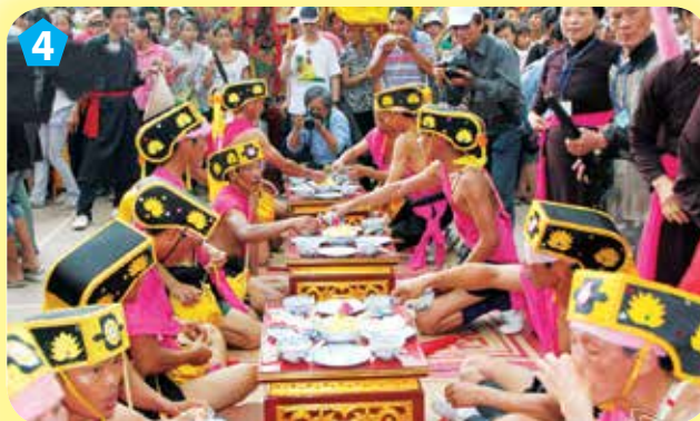
Lễ khao quân