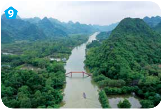
9 Suối Yến, huyện Mỹ Đức