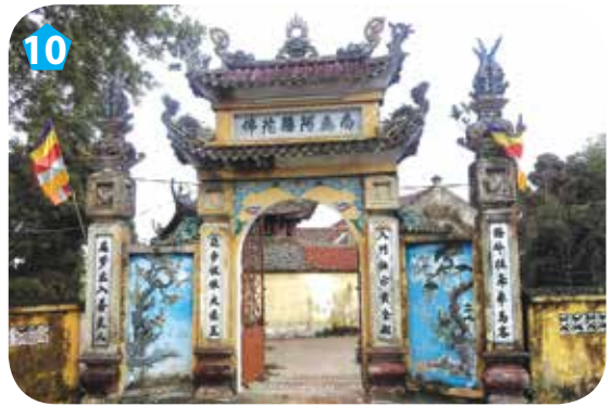
10 Chùa Pháp Vân, huyện Thường Tín