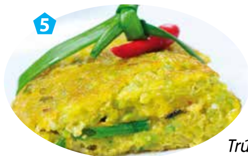
Trứng tráng cốm thịt