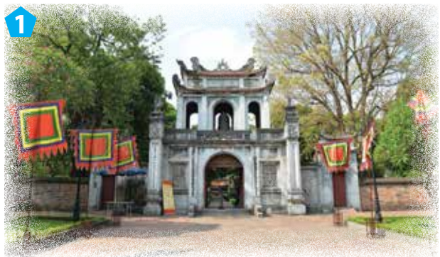
Cổng Văn Miếu – Quốc Tử Giám

1. Kể tên một số công trình trong khu di tích Văn Miếu – Quốc Tử Giám qua các bức ảnh sau: