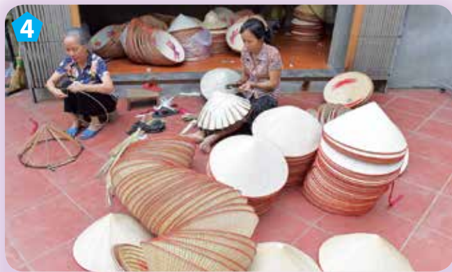
Làm nón ở làng Chuông