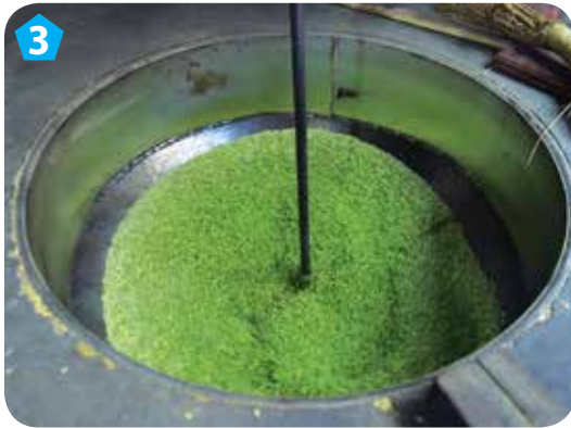
3 Rang thóc ở nhiệt độ cao để bong lớp vỏ trấu