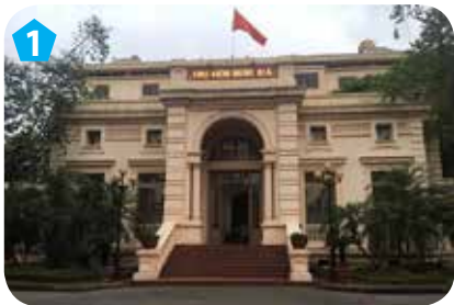
Thư viện Quốc gia, quận Hoàn Kiếm