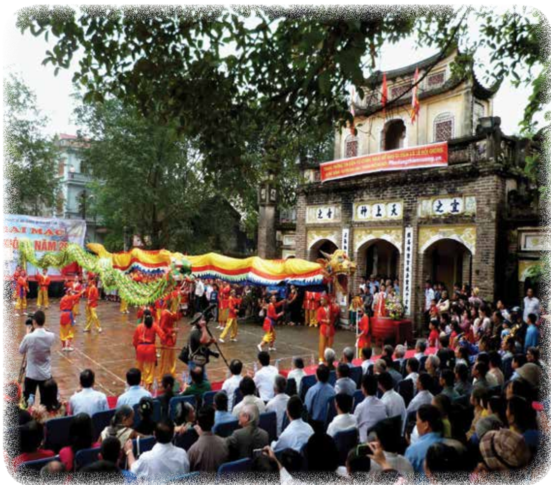
Múa rồng trong hội Gióng ở đền Phù Đổng, huyện Gia Lâm

Quan sát và kể những gì em thấy qua bức ảnh sau: