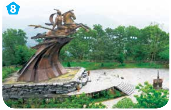
8 Tượng Thánh Gióng, huyện Sóc Sơn