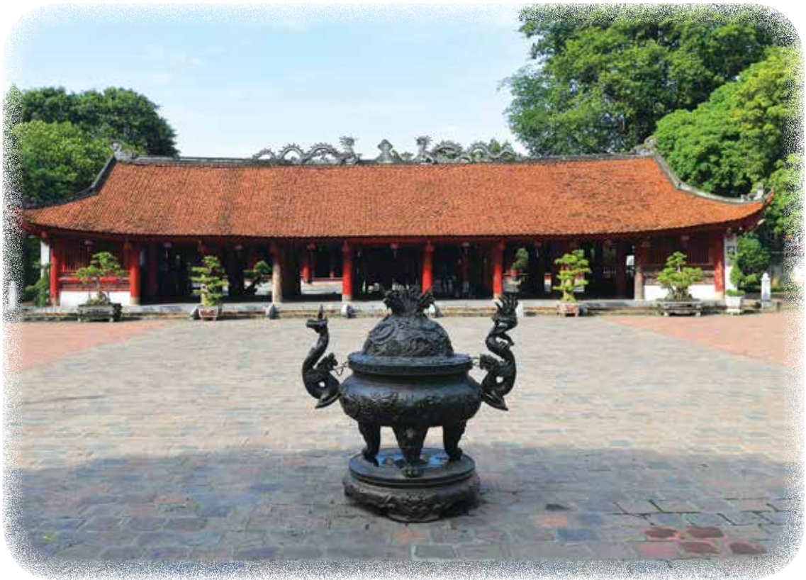
Nhà bái đường Văn Miếu - Quốc Tử Giám