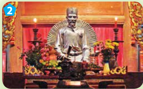
Ban thờ Chu Văn An