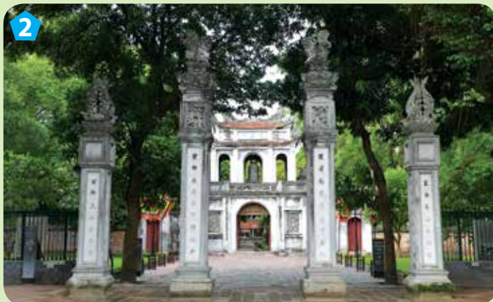
Khu tiền án