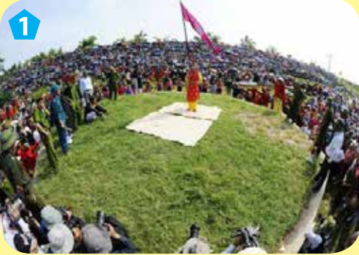
Ông Hiệu cờ