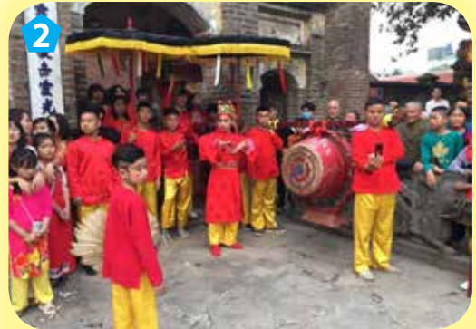
Ông Hiệu trống