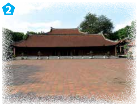
Nhà Tiền đường – Khu Thái học