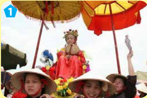
Lễ rước "Cô Tướng"

1. Quan sát các hình dưới đây và kể một số hoạt động tiêu biểu trong hội Gióng.