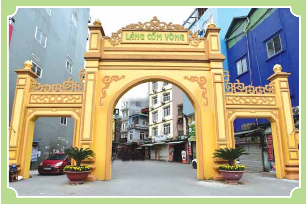
Cổng làng Cốm Vòng

Cốm làng Vòng là một món ăn đặc sản của làng Vòng, thuộc phường Dịch Vọng Hậu, quận Cầu Giấy.