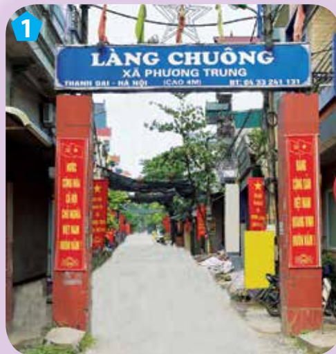
Cổng làng Chuông

Quan sát hình và kể những điều em thấy ở làng Chuông.