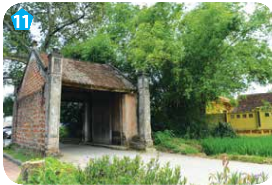
11 Cổng làng Mông Phụ, thị xã Sơn Tây