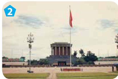
Quảng trường Ba Đình, quận Ba Đình