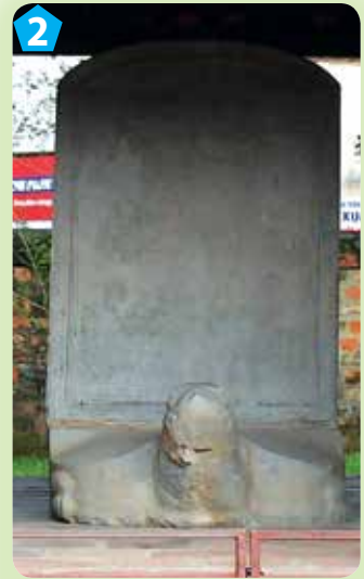
Bia tiến sĩ

3. Kể tên một số nhân vật lịch sử được thờ trong khu di tích Văn Miếu - Quốc Tử Giám qua các bức ảnh sau: