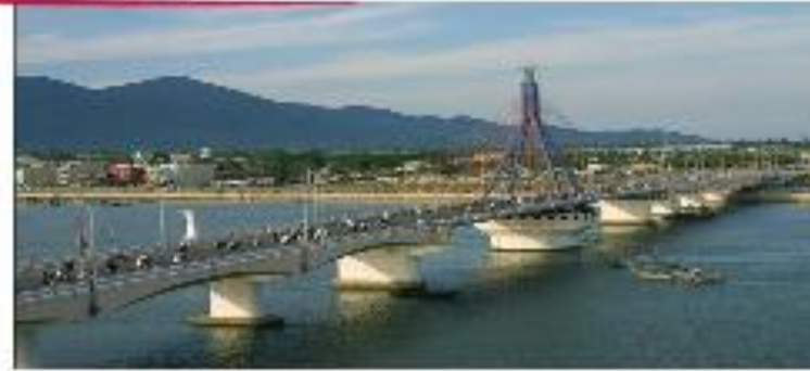
Cầu sông Hàn