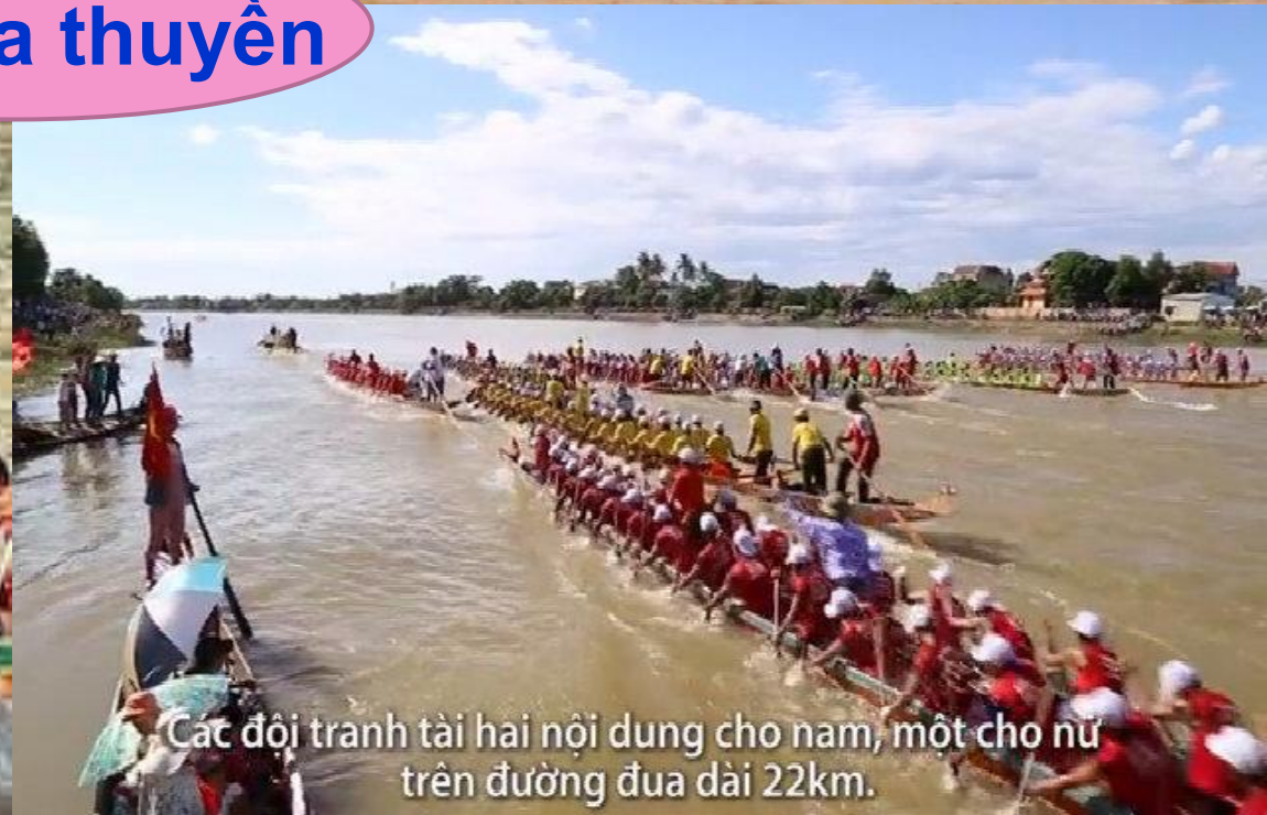
Các đội tranh tài hai nội dung cho nam, một cho nữ trên đường đua dài 22km.