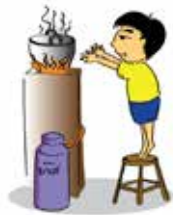
Bỏ mặc, không giám sát trẻ