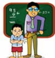
Đánh đập và nhạo báng trẻ ở trường học