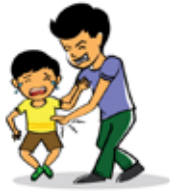
Trẻ gheo trẻ một cách quá đáng