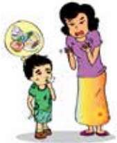
Không chăm sóc trẻ, ví dụ: không tắm rửa, thay quần áo, cho trẻ ăn uống