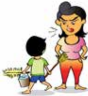
Sử dụng trẻ như một nô lệ