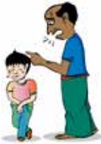
Xâm hại bằng lời nói