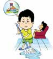
Bắt trẻ làm việc quá nhiều ảnh hưởng tới việc học tập, vui chơi của trẻ