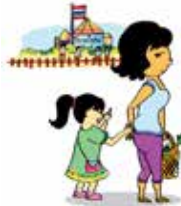
Không quan tâm tới nhu cầu học tập của trẻ