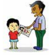
Cho trẻ xem phim, ảnh, ấn phẩm có nội dung đồi trụy