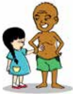
Ép buộc trẻ sờ mó vào cơ thể mình