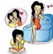
Phớt lờ nhu cầu được yêu thương của trẻ