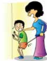
Đánh đập hoặc làm tổn thương trẻ