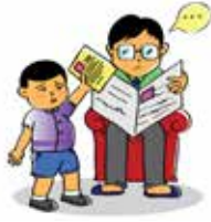
Xâm phạm sự riêng tư của trẻ