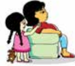
Phớt lờ trẻ