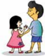
Sờ mó những bộ phận riêng tư trên cơ thể trẻ