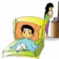
Không quan tâm tới nhu cầu chăm sóc sức khỏe của trẻ