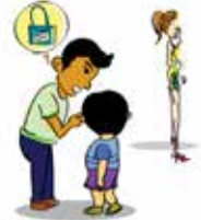
Dụ dỗ trẻ