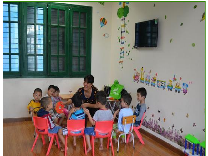
Giờ học can thiệp sớm