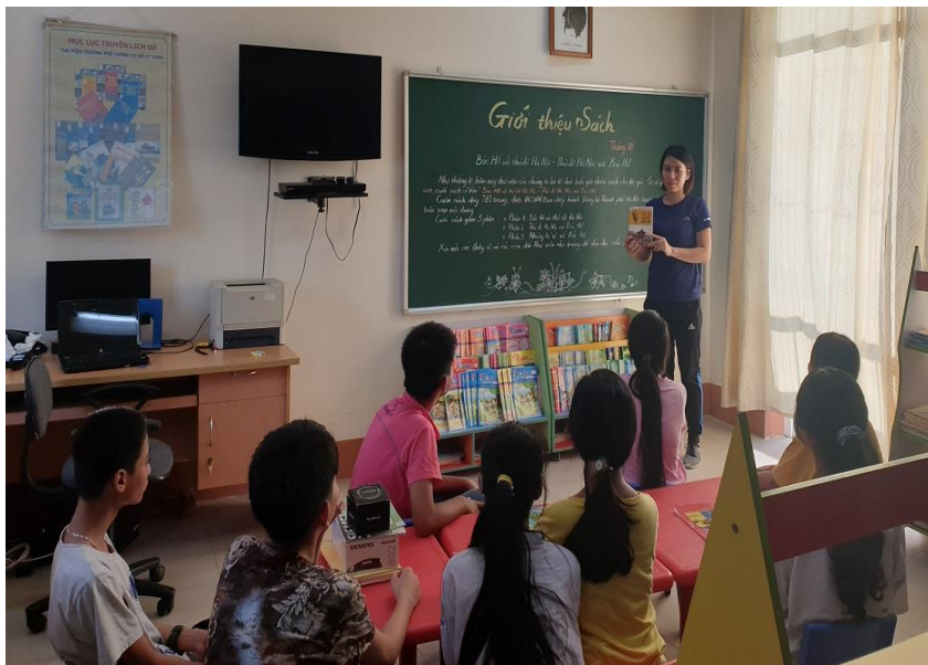
Hoạt động đọc sách tại thư viện