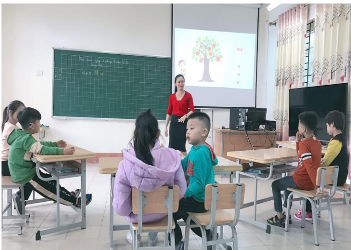
Giờ học Tiếng Việt lớp 1

Tư vấn kiến thức, kĩ năng chăm sóc, giáo dục giáo dục trẻ khiếm thính cho cha mẹ học sinh