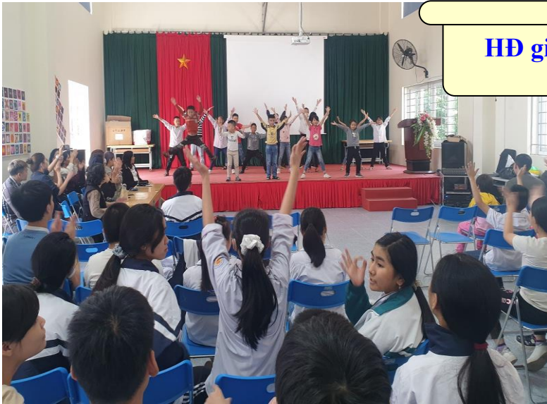
HD giao lưu