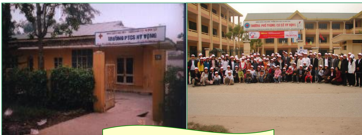
Hình ảnh trường Hy Vọng trước và sau khi được xây mới

➔ Năm học 2006 – 2007, được sự quan tâm, giúp đỡ của Quận ủy, UBND, Phòng GD&ĐT quận Long Biên, trường PTCS Hy Vọng đã có một ngôi trường mới khang trang, đầy đủ các phòng học, phòng chức năng đáp ứng được các hoạt động giảng dạy, hướng nghiệp, hoạt động tập thể, phục hồi chức năng, giáo dục học sinh.