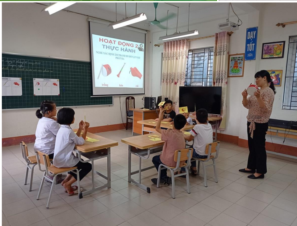
Giờ Luyện nghe lớp 2