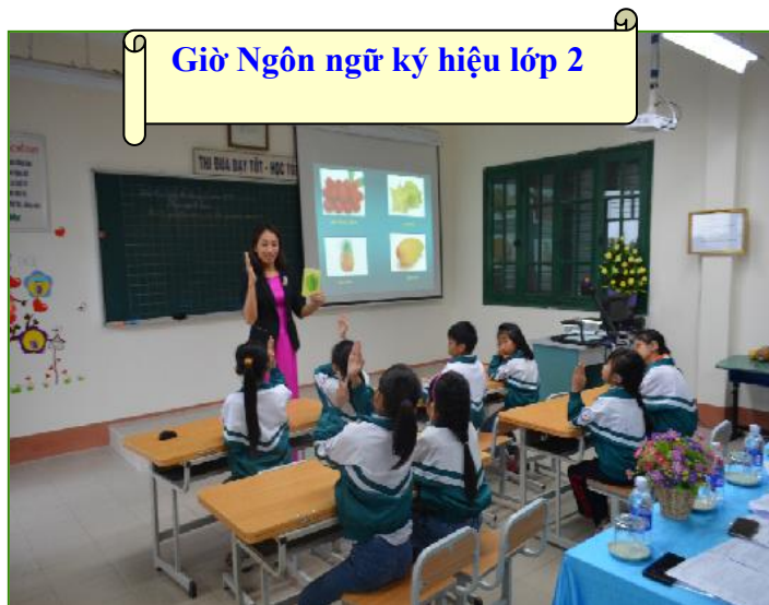
Giờ Ngôn ngữ ký hiệu lớp 2