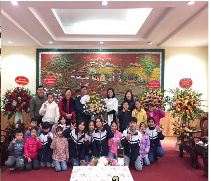
Thăm các chú bộ đội nhân ngày 22/12