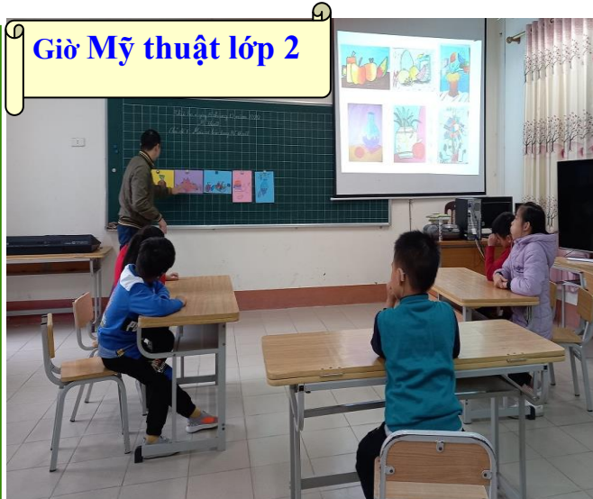
Giờ Mỹ thuật lớp 2