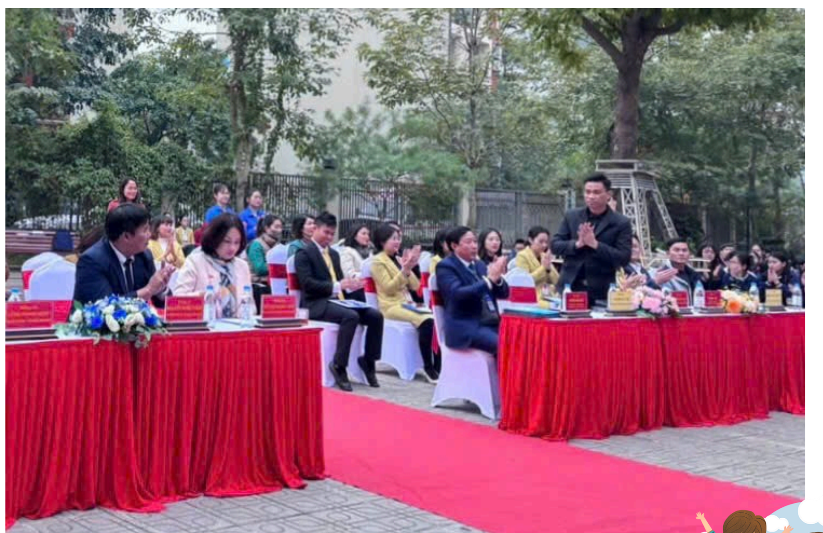
Đại diện lãnh đạo Chi cục Dân số Hà Nội; lãnh đạo Trung tâm y tế quận Long Biên, Phòng Giáo dục và Đào tạo quận Long Biên tới tham dự Hội thi