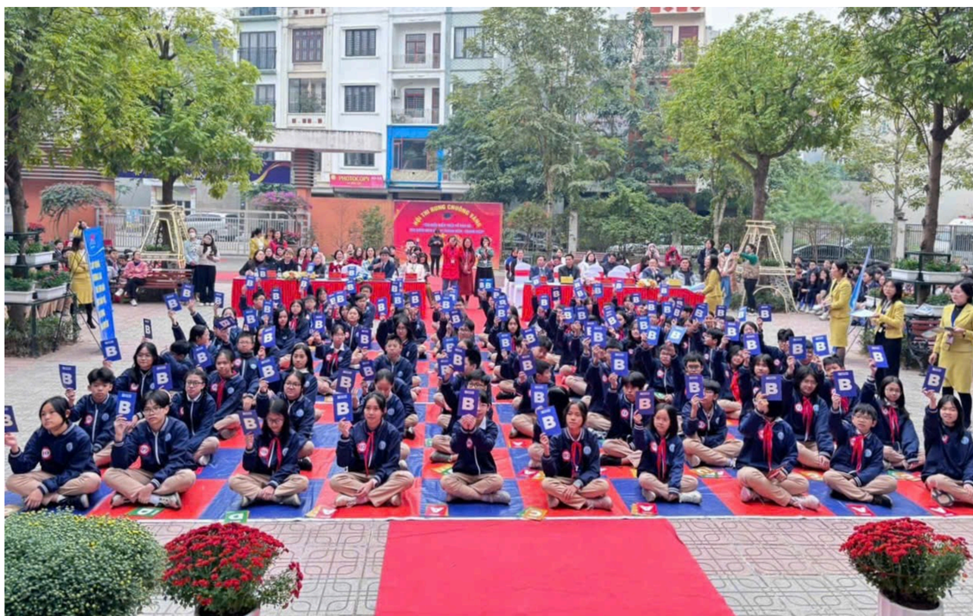
Các em học sinh Nhà trường hào hứng trong Hội thi