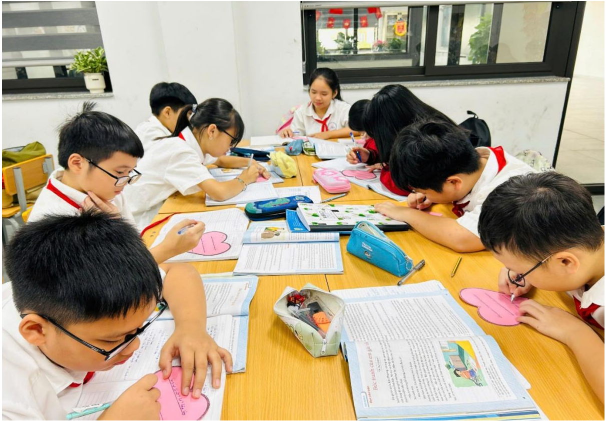
Các con chia sẻ yêu thương sau tiết học