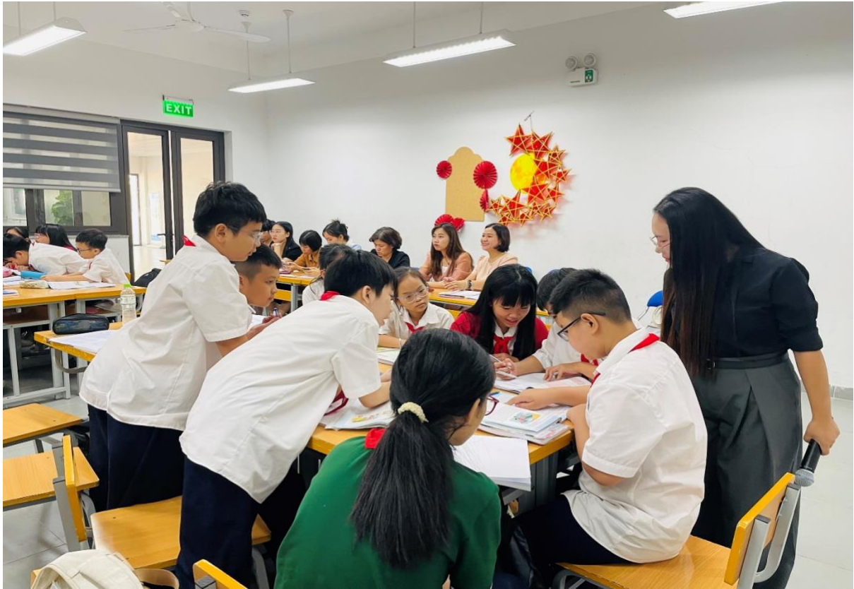
Các con thảo luận cùng góp ý, tháo gỡ những vấn đề trong bài học.