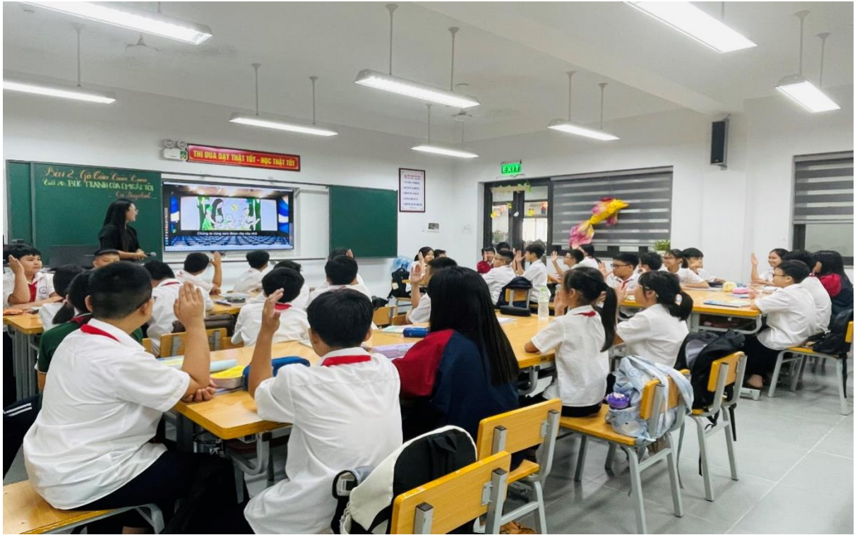
Các con rất hào hứng, sôi nổi trong tiết học.