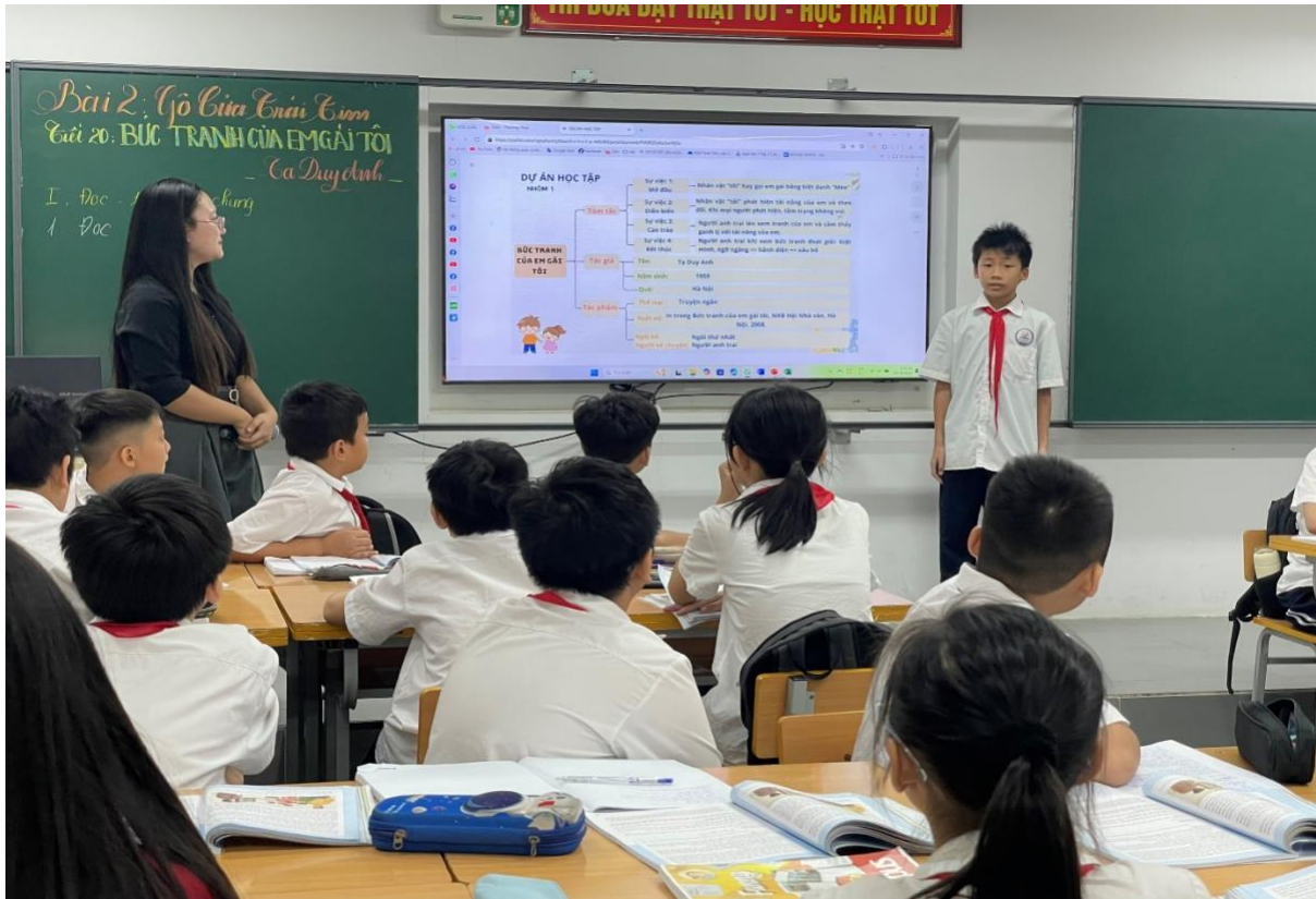
Học sinh tự tin tham gia hoạt động của tiết học.