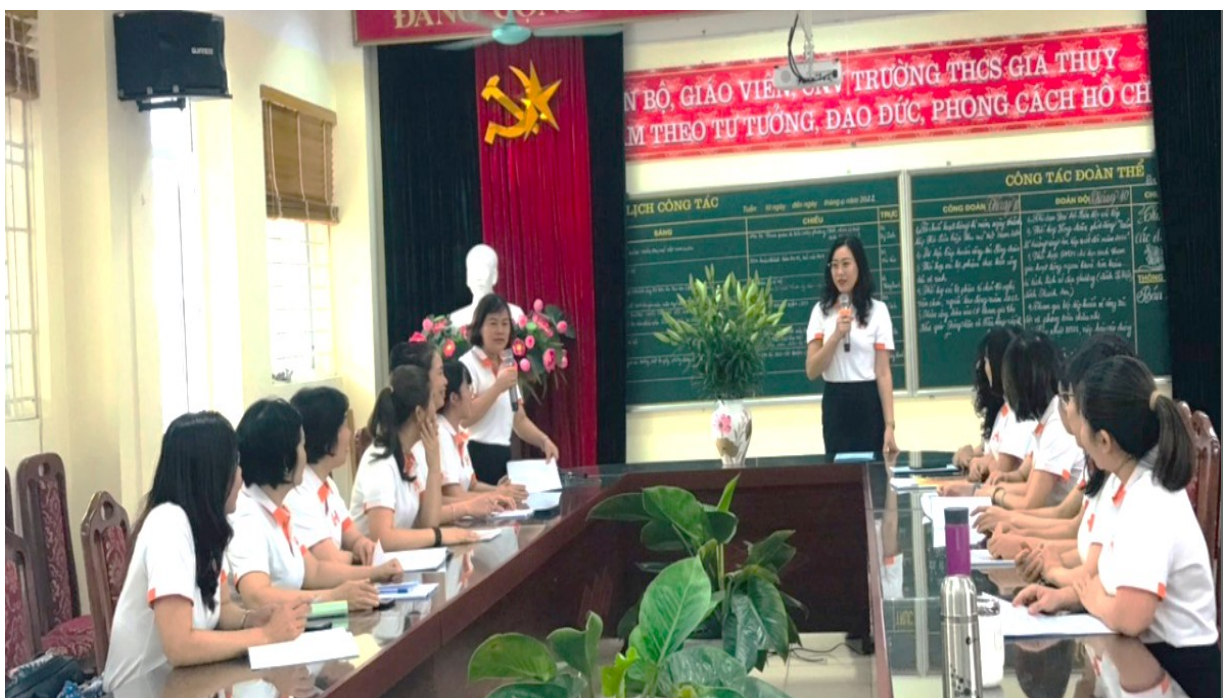
Các thầy cô nhóm Lịch sử đang thảo luận chuyên đề