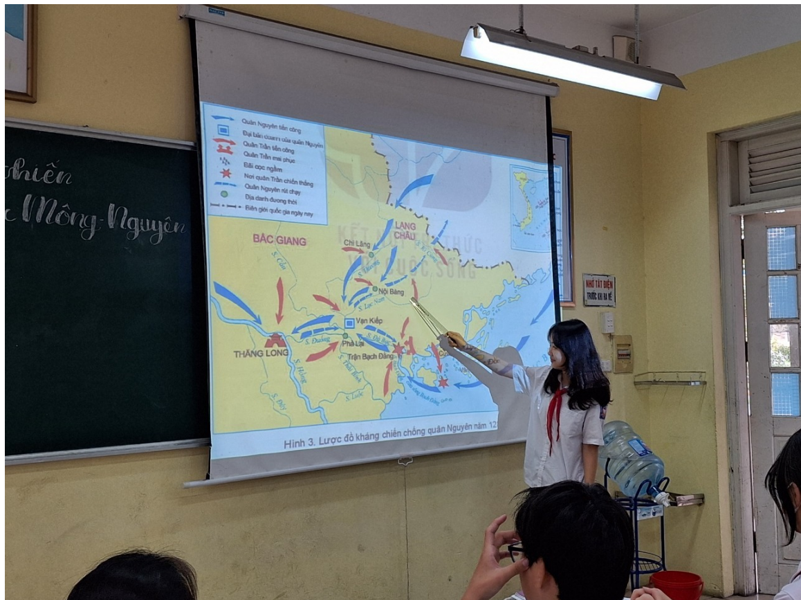
Hình ảnh học sinh tham gia tiết học