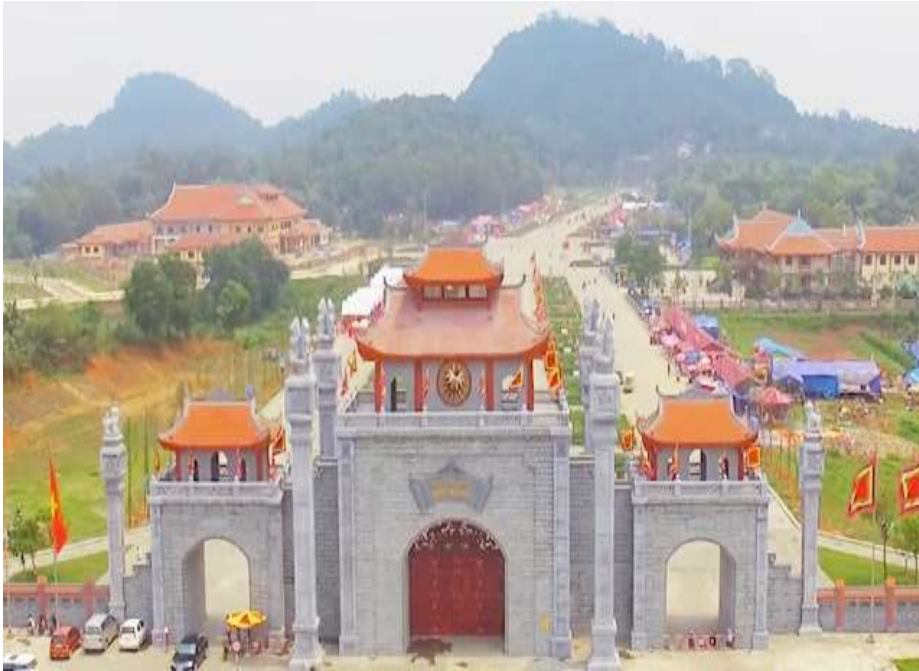
Đền Hùng (Nước Văn Lang)

Đây là công trình kiến trúc nào? Thuộc nhà nước nào trong lịch sử Việt Nam?