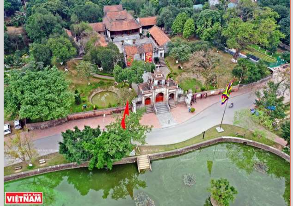
Thành Cổ Loa (Nước Âu Lạc)