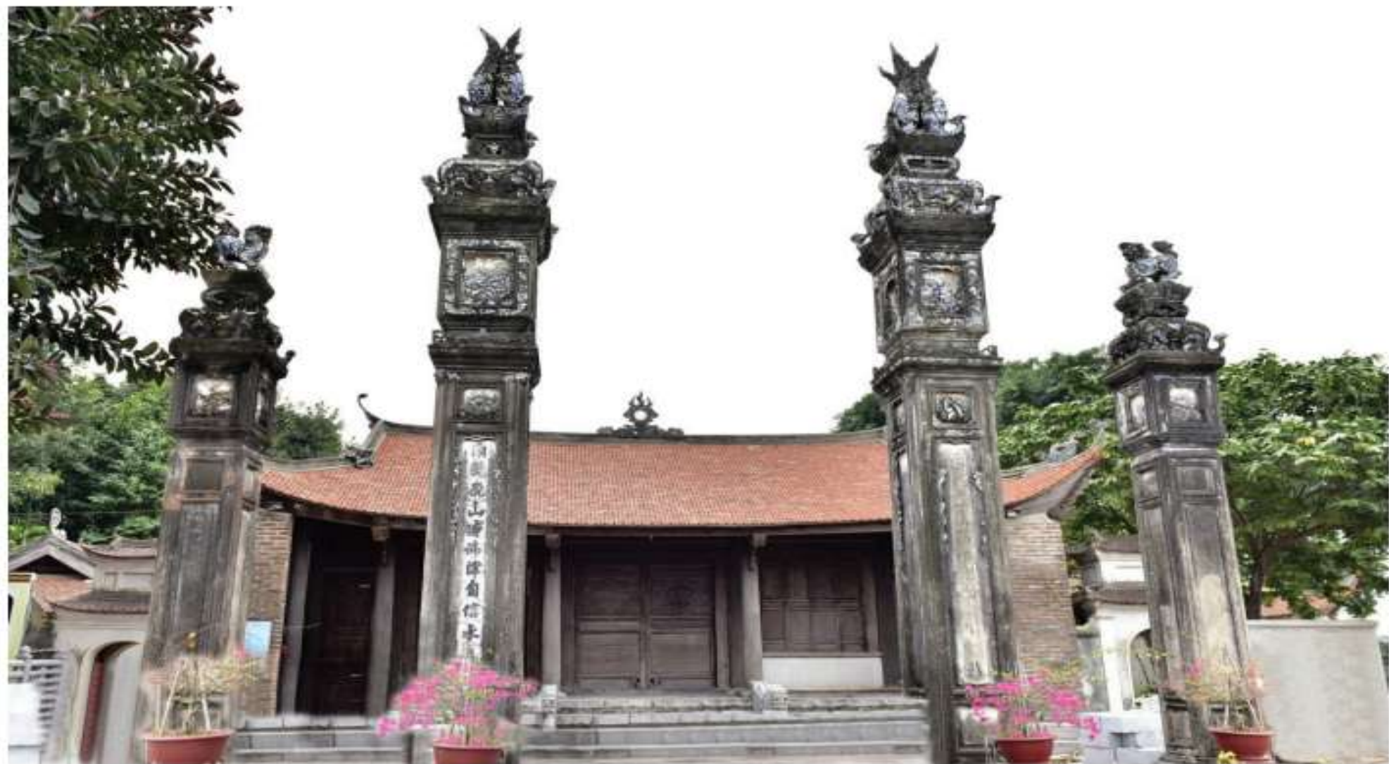
Hình 1.3. Đình Chèm (phường Thụy Phương, quận Bắc Từ Liêm) – tương truyền làng Chèm là ngôi làng cổ từ thời Hùng Vương