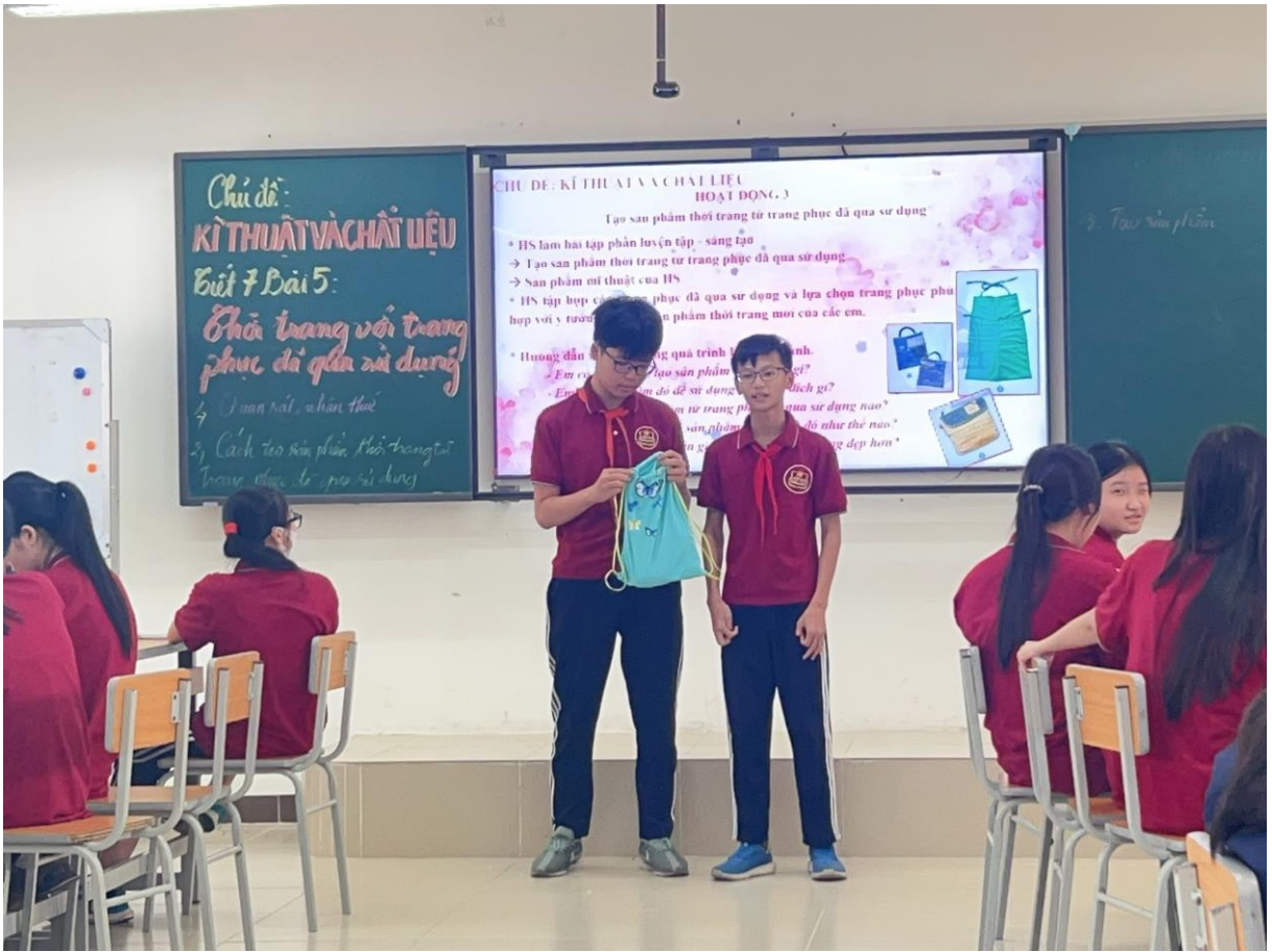
Dưới đây là một số hình ảnh về sản phẩm của học sinh: