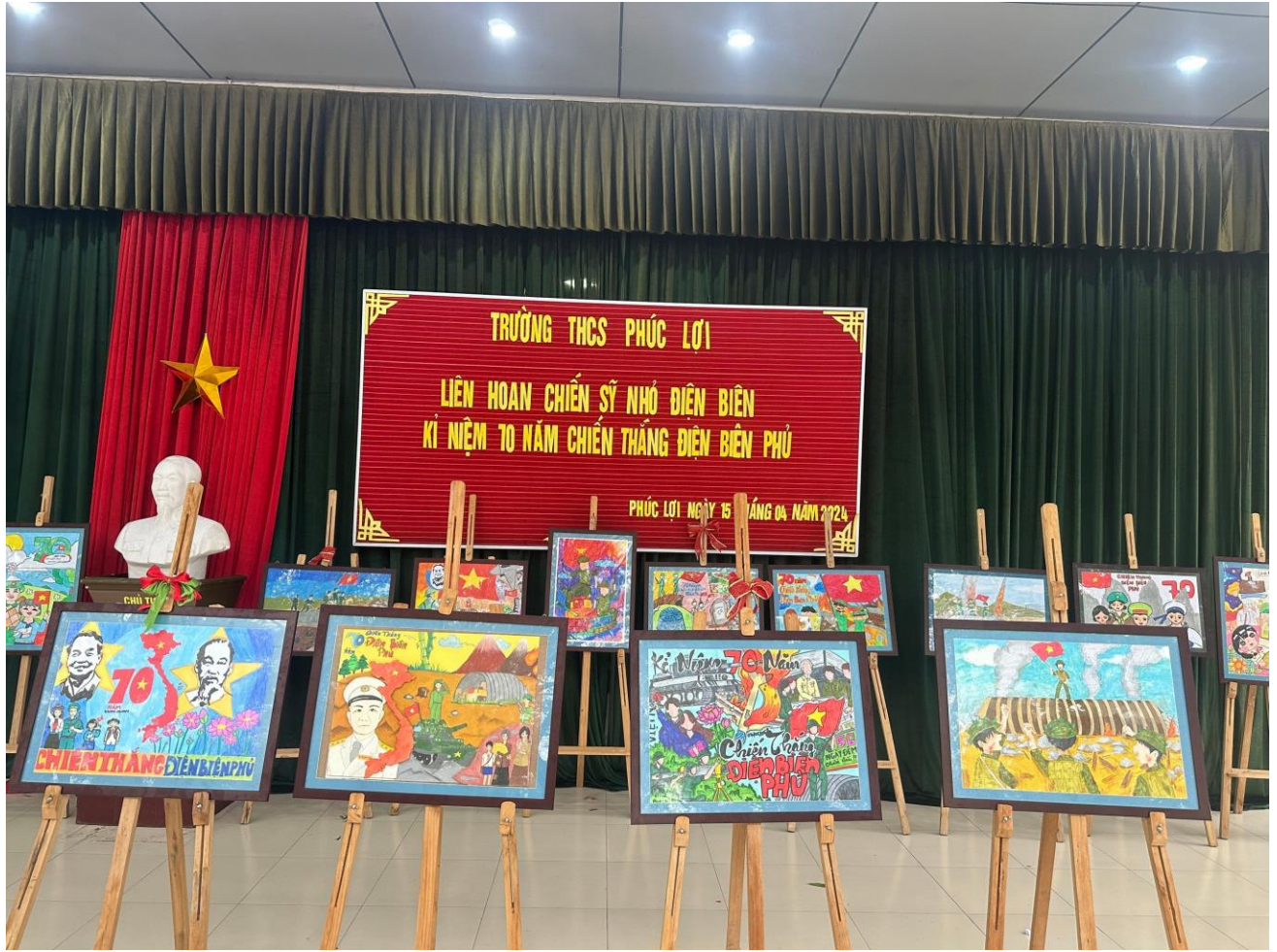
Thi vẽ tranh kỉ niệm 70 năm chiến thắng Lịch sử Điện Biên Phủ