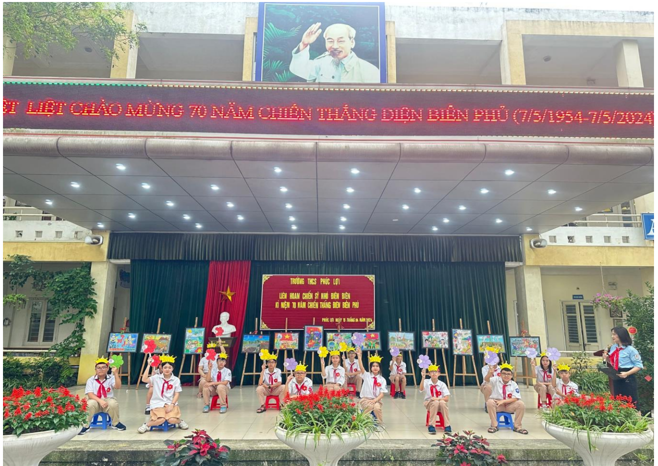
Thi Rung chuông vàng