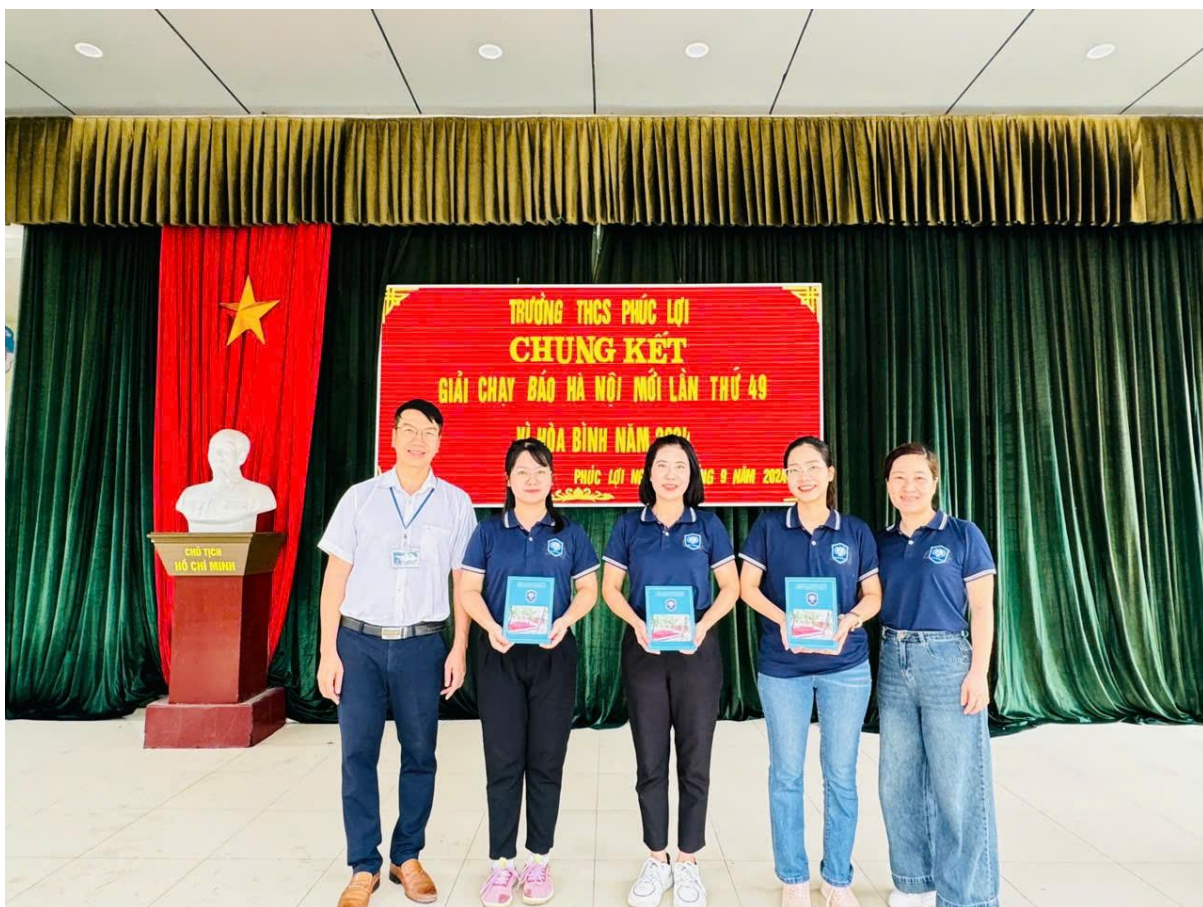
Ban tổ chức trao giải cho các vận động viên chiến thắng ở nội dung chạy nữ