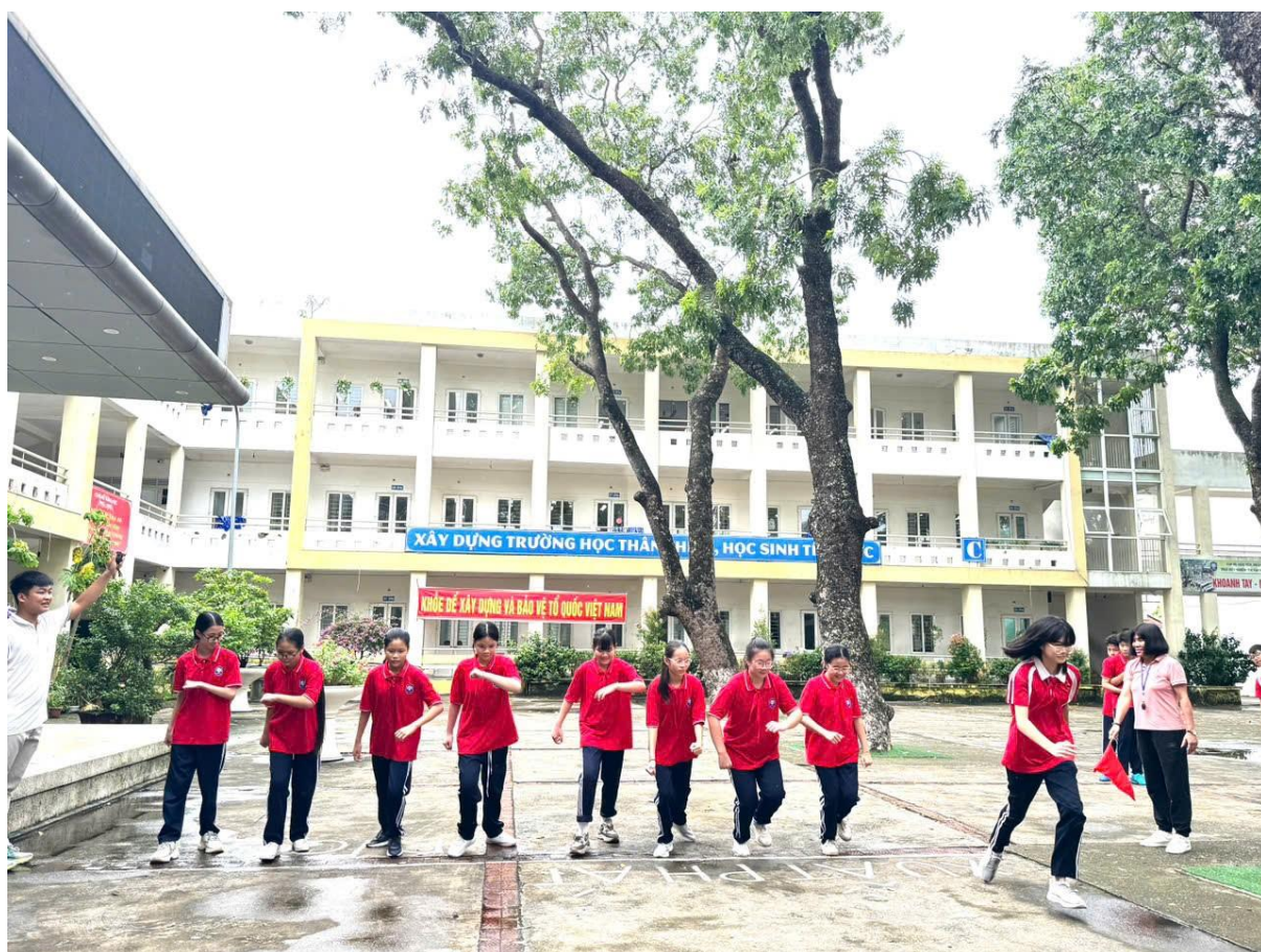
Lượt chạy của học sinh nữ khối 8, 9

Theo kế hoạch, mọi công tác chuẩn bị cho Giải chạy báo đã được hoàn thành vào chiều ngày 9/9. Đúng 14h00 chiều ngày 10/9, tập thể cán bộ giáo viên và học sinh đã có mặt tại sân trường để chuẩn bị cho giải chạy. Trên khuôn mặt ai cũng tràn đầy tự tin để bước vào cuộc thi tài.