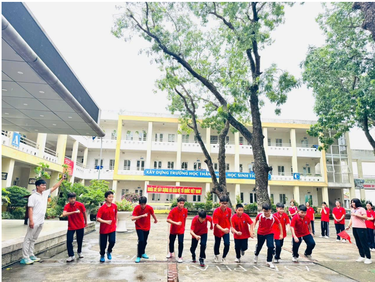
Lượt chạy của học sinh nam khối 8, 9