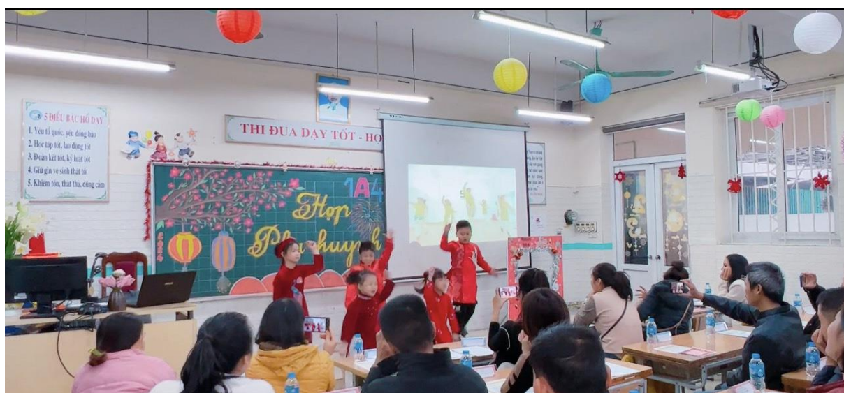
Các bạn Gà con nhảy múa “Tết đông đầy”

Mở đầu buổi họp tại lớp 1A4, các con học sinh tự tin biểu diễn các tiết mục văn nghệ là chính các tiết mục mà các con đã chuẩn bị dành tặng bố mẹ. Các bậc phụ huynh vô cùng bất ngờ và tự hào khi nhìn thấy sự tự tin thể hiện bản thân của con mình.