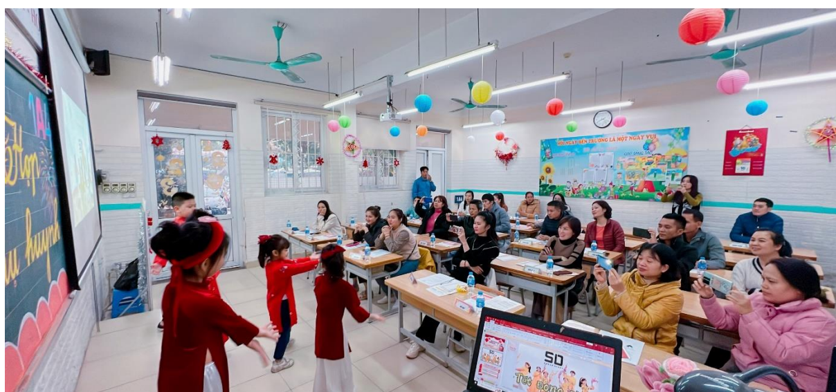
Các bạn nhỏ lớp 1A4 thật đáng yêu và duyên dáng đem lại không khí mùa xuân đến lớp học.