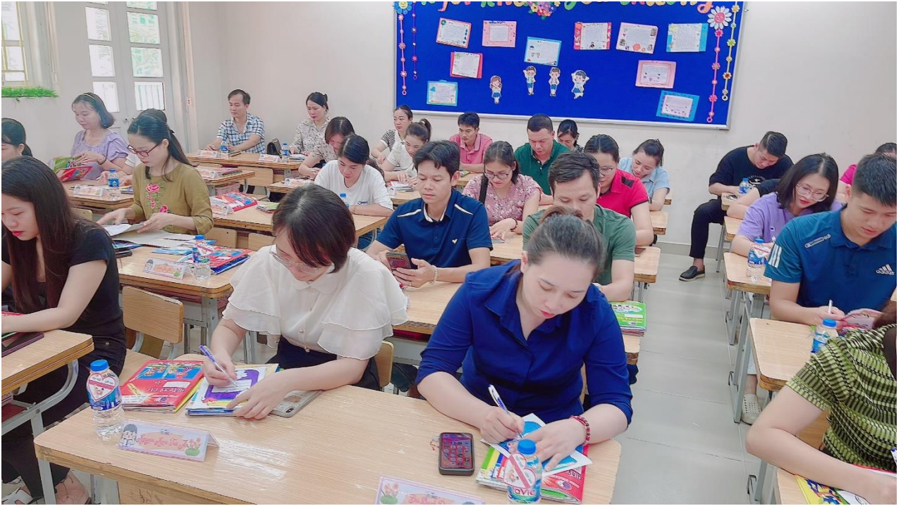
Cha mẹ học sinh viết cho các con những dặn dò yêu thương