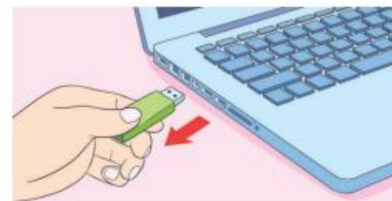
▲ Hình 2.3. Rút USB khi chưa ngắt kết nối với máy tính