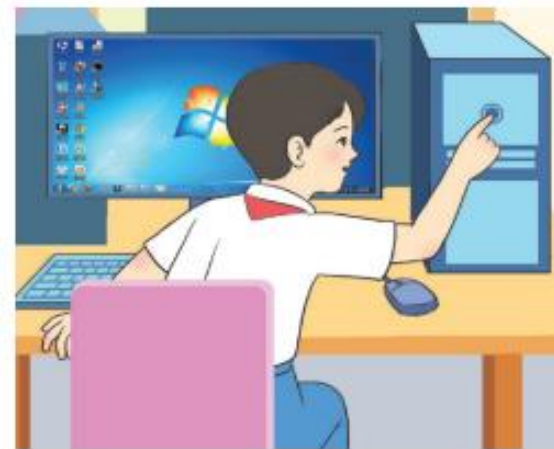
▲ Hình 2.2. Tắt máy tính bằng cách giữ nút nguồn