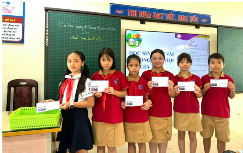
Tham gia chương trình “Trung thu sẻ chia”