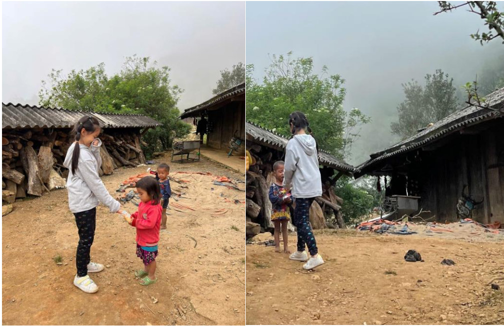
Gửi những món quà đến các em nhỏ vùng cao

âm khiến cho Vân không khỏi xúc động và em đã tâm niệm sẽ tiếp nối hành trình ý nghĩa này. Tôi cũng sẽ chẳng thể nào quên được hành động nhỏ mà đầy ý nghĩa, lấp lánh vẻ đẹp tâm hồn của em trong những hoạt động thiện nguyện của nhà trường. Em đã dành phần tiền quà sáng của bản thân để tặng cho bạn nghèo và những hoàn cảnh khó khăn trong các phong trào từ thiện của nhà trường phát động. Các hoạt động thiện nguyện như “Trung thu sẻ chia”, “Mua tấm ủng hộ người mù”,... đã được em tích cực hưởng ứng, khuyến khích các bạn khác trong lớp tham gia và bản thân em cũng có nhiều đóng góp thiết thực từ số tiền dành dụm được.