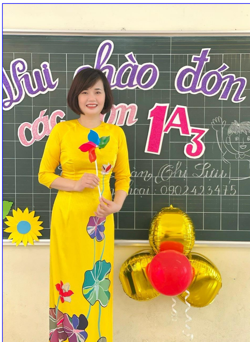
Người mẹ hiền thứ hai của các con học sinh lớp Một

Bằng tình yêu trẻ, sự say mê, tâm huyết với nghề giáo, cô không ngừng cống hiến cho sự nghiệp giáo dục. Cô đã dạy dỗ rất nhiều lứa học sinh khối 1, khối lớp mà biết bao điều bỡ ngỡ, vụng về ngỡ ngàng khi các con lần đầu tiên cắp sách đến trường, lần đầu tiên được mở trang sách vở, ê a học bài. Mỗi năm học, ngày khai giảng luôn là ngày thật đặc biệt của các con học sinh lớp Một, của bố mẹ và gia đình các con. Đó là ngày đầu tiên con bước chân đến trường học, bắt đầu trở thành những cô cậu học trò nhỏ trên con đường học tập. Yêu biết mấy những đôi mắt to tròn, ngây thơ của các con núp sau bóng bố mẹ, thỉnh thoảng mới dám ló ra ngấm nhìn ngôi trường rộng lớn, lớp học khang trang. Yêu biết mấy những khoảnh khắc các con mạnh mẽ, thu hết can đảm để rời bàn tay bố mẹ bước vào lớp học cùng các cô giáo mới, bạn học mới. Có bạn dũng cảm, một mình tự tin bước vào lớp, có bạn rung rung đôi mắt long lanh, cố kiềm chế, hay có cả những bạn khóc òa lên níu tay bố mẹ... Tất cả những điều đó cô Lụa đều hiểu và thấu cảm. Cô luôn mỉm cười thật tươi chào đón các con, dịu dàng và gần gũi đưa đôi bàn tay của mình ra để đỡ lấy đôi bàn tay nhỏ bé của các con. Cái