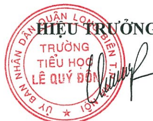
Đồng Thị Quyên

7. Thời gian trả lời, giải quyết ý kiến thắc mắc: chậm nhất sau 5 ngày làm việc.