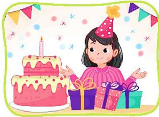
Đự sinh nhật bạn