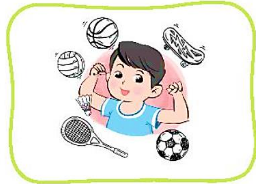
Tập thể thao