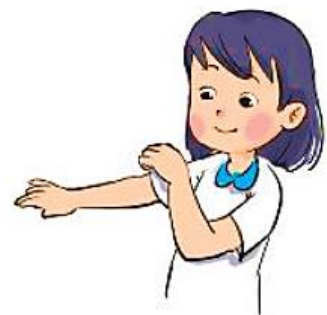
Mặc quần áo