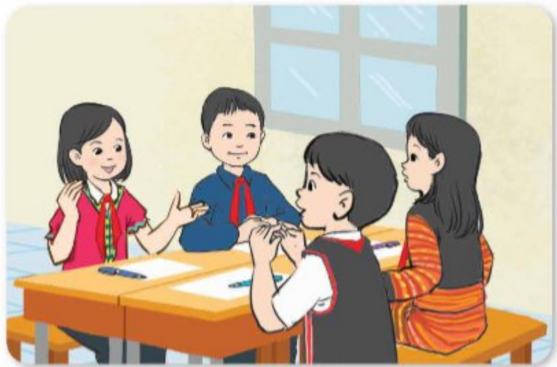
a) Trẻ em đi học

Trẻ em đang học tập Ý nghĩa của việc học tập là: Trẻ em khi còn nhỏ cần học tập, rèn luyện tốt, có kỹ năng tốt để lớn lên thành người tốt, có ích cho xã hội.