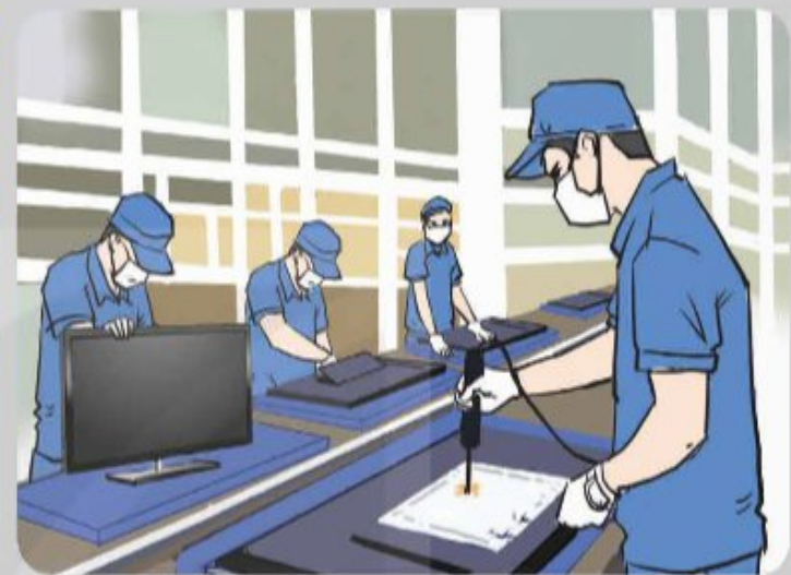
Người lớn hình thành tham gia lao động, sản xuất