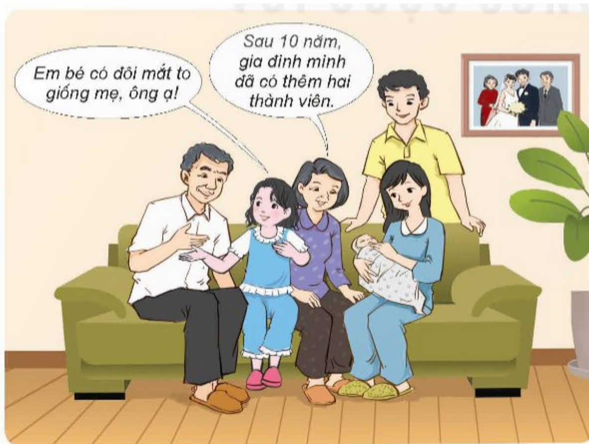
Hình 1. Gia đình An