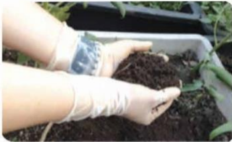
b) Đeo găng tay khi tiếp xúc với đất

Ngăn cách cơ thể tiếp xúc trực tiếp với vi khuẩn trong đất.