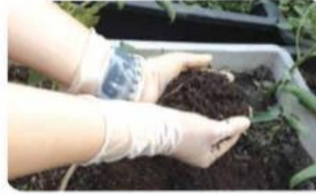
b) Đeo găng tay khi tiếp xúc với đất