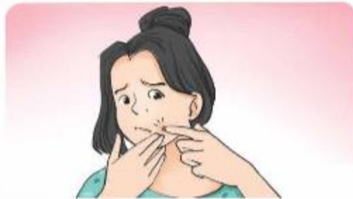
a) Nặn mụn bằng tay