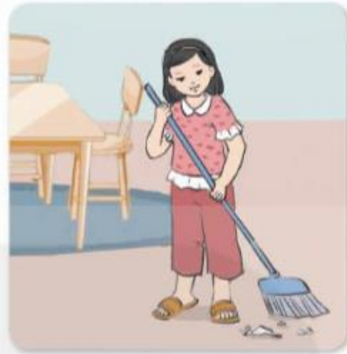
c) Làm sạch nơi ở, nơi làm việc