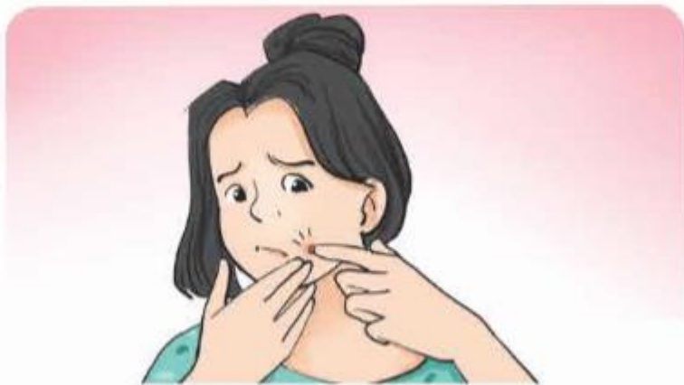
a) Nặn mụn bằng tay

Vi khuẩn gây bệnh xâm nhập cơ thể qua vết thương hở.