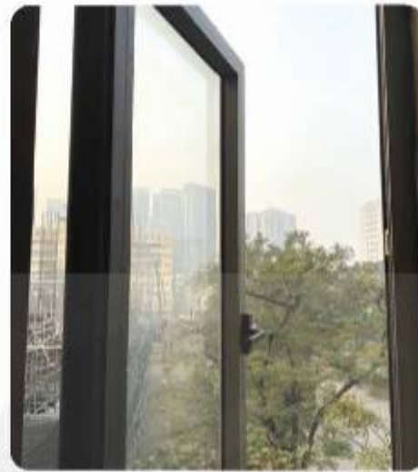
d) Mở cửa sổ thường xuyên