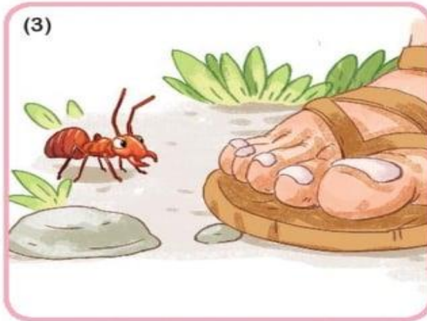
Một hôm kiến thấy (...)