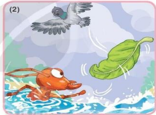
Nghe tiếng kêu cứu (...)