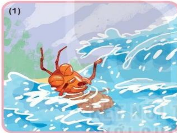
Một con kiến (...)