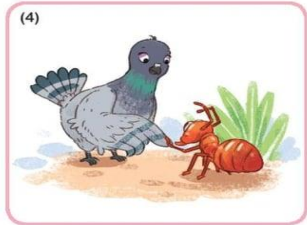
Bồ câu tìm đến chỗ kiến (...)