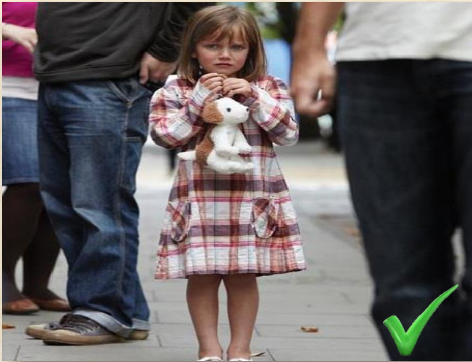
Bình tĩnh nhận ra mình bị lạc