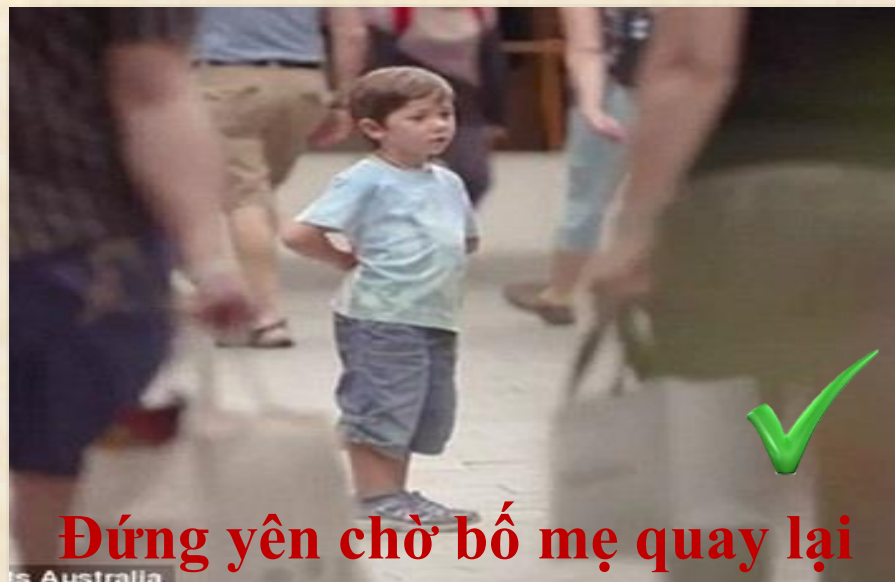
Đứng yên chờ bố mẹ quay lại