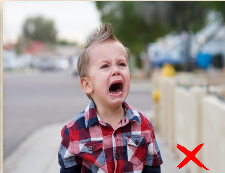
Không khóc và la hét