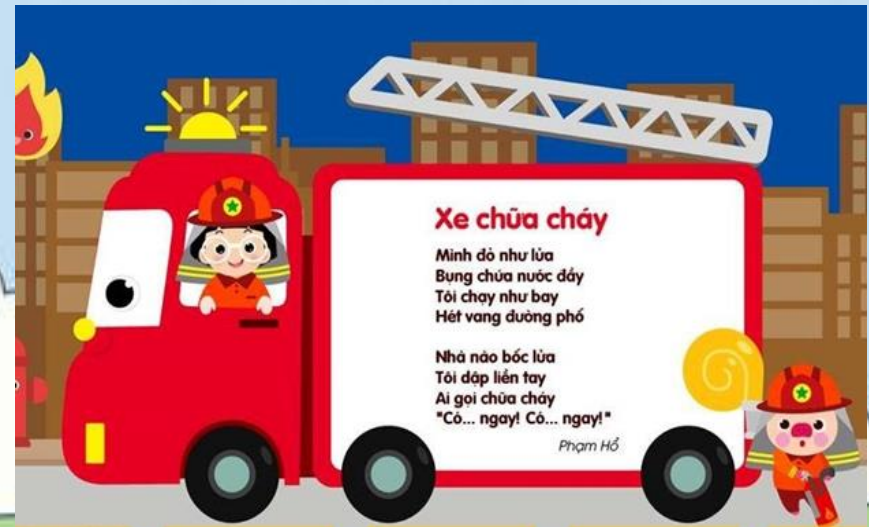
2. Xe chữa cháy – Phạm Hồ