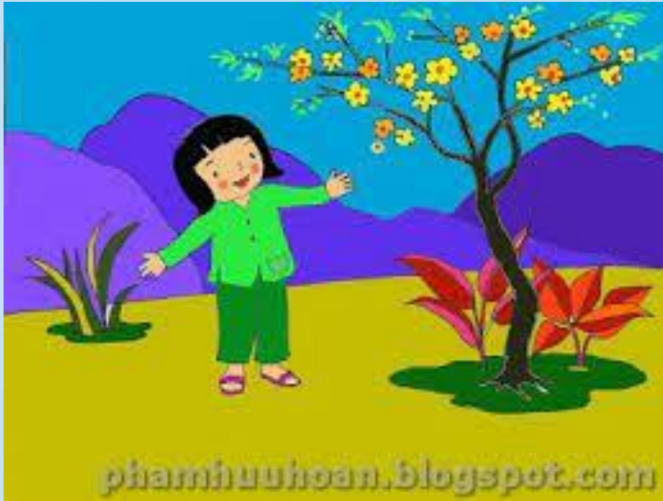
1. Mùa Xuân- Dương khâu Luông