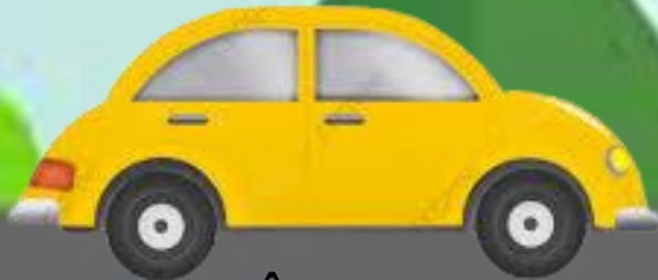
1. Xe Ô Tô con

Có vòi mà chẳng có đuôi Bụng chỉ thích chứa nước thôi mới kì Bình thường chỉ nói năng chi Gặp lửa lại càu phì phì lạ chưa ? Là xe gì?