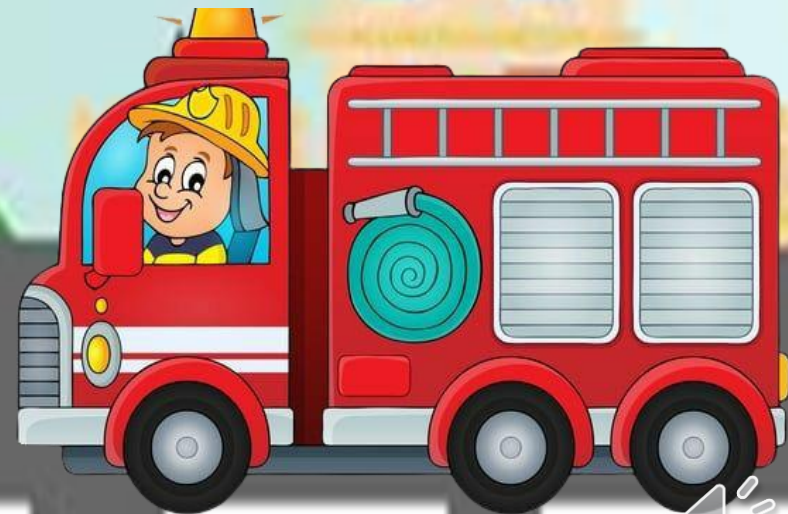
2. Xe chữa cháy