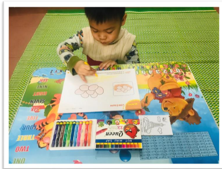
Hình ảnh 5: Trẻ đi màu làm ổ rom