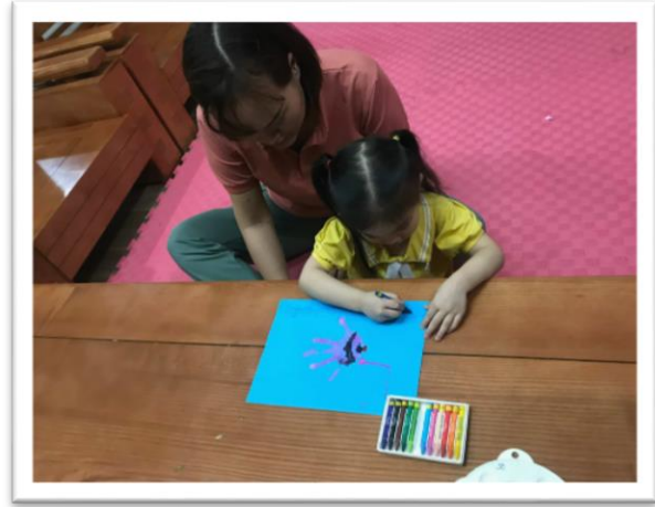
Hình ảnh 3: Bé Nhím In bàn tay tạo thành con cá