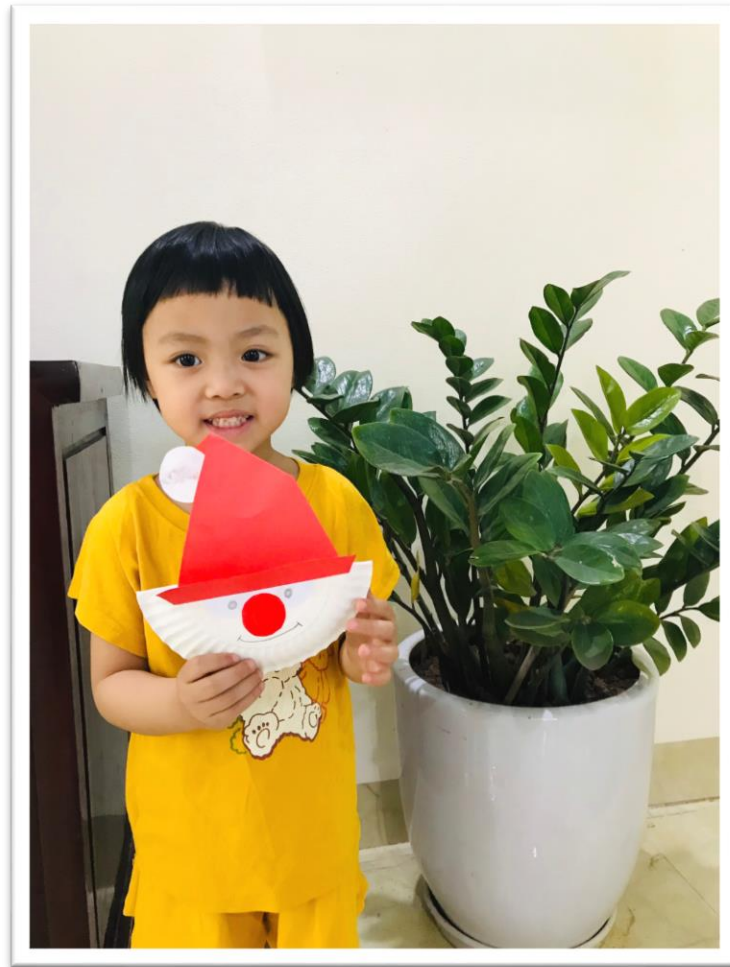
Hình ảnh 4: Trang trí ông già noel bằng đĩa giấy