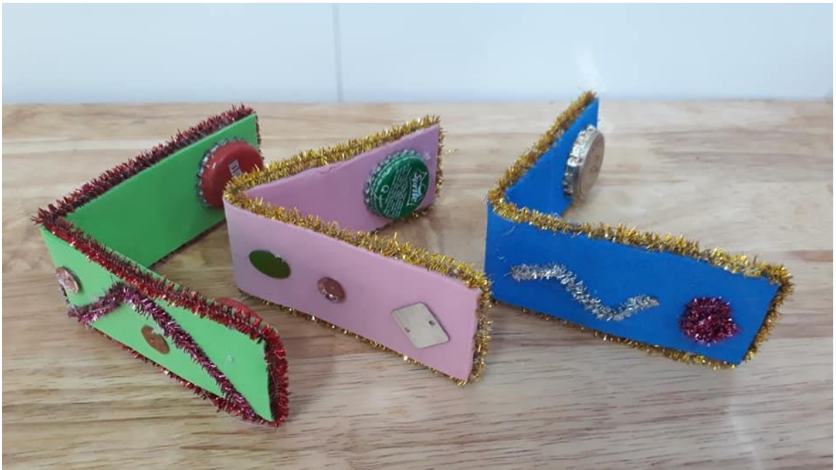
Song loan làm từ bì giấy và nắp chai bia