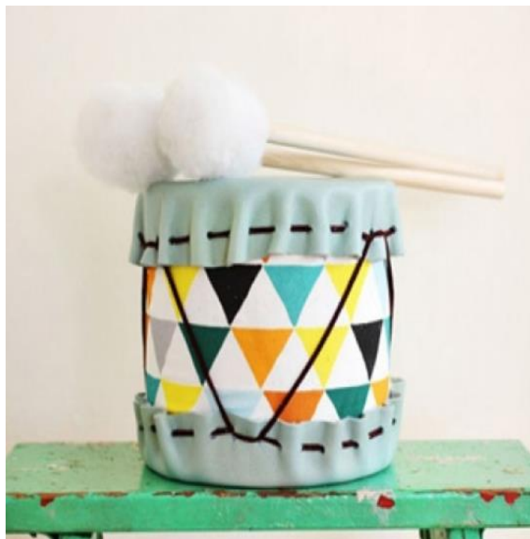
Trống làm từ vỏ hộp sữa ông thọ