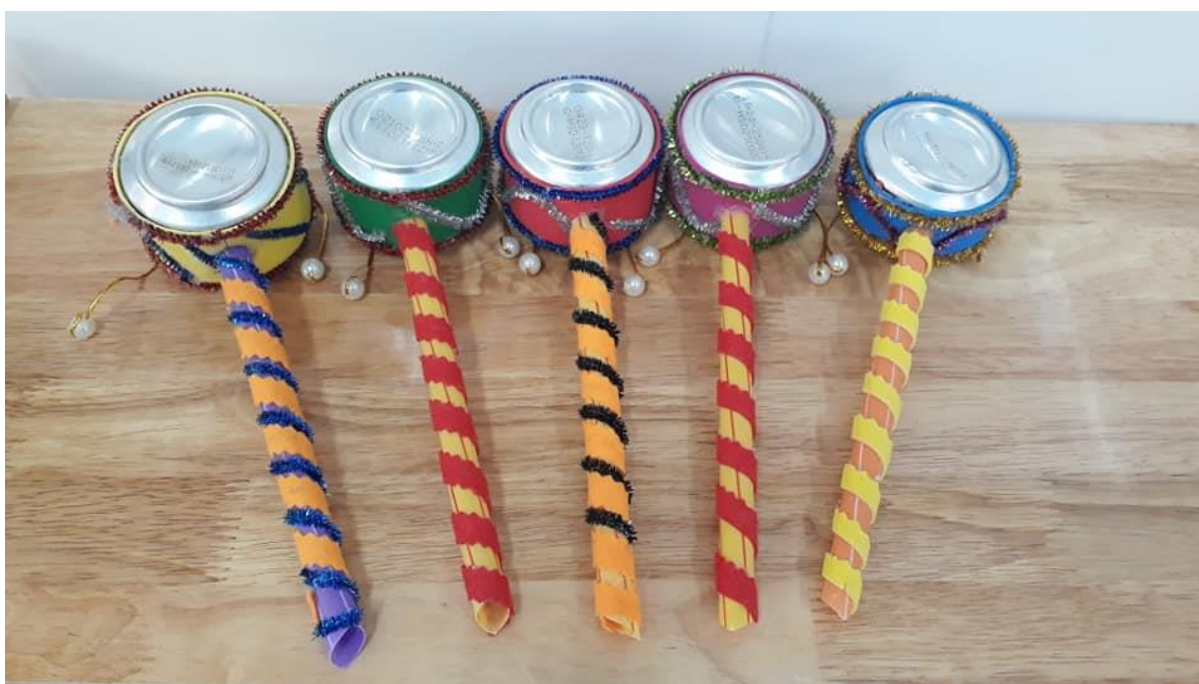
Trống lắc làm từ vỏ lon bia