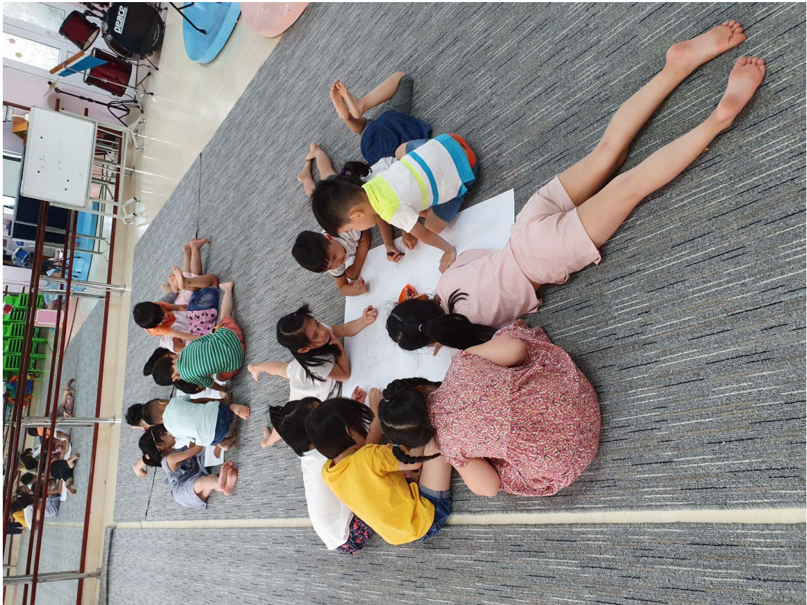
Phụ lục 5: Ảnh cô và trẻ trong giờ “Dạy trẻ cảm thụ âm nhạc qua tiết tấu nhanh- chậm”