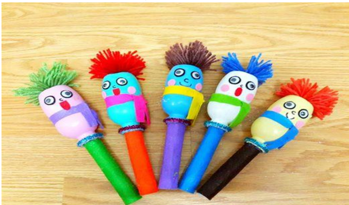
Lục lạc làm từ vỏ sữa su su