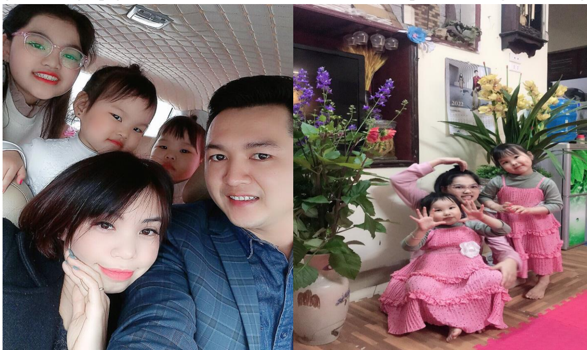
Hình ảnh: Gia đình nhỏ đầm ấm của cô Huyền

Ở gia đình, cô Huyền là một người cháu dâu thảo, con dâu ngoan, người vợ hiền, người mẹ yêu thương con cái, luôn cố gắng chăm sóc cho mái ấm bằng tình thương của mình. Cô luôn sắp xếp công việc hợp lý để có thời gian chăm lo gia đình, giúp gia đình nhỏ của cô luôn êm ấm, hạnh phúc, con ngoan, học giỏi.