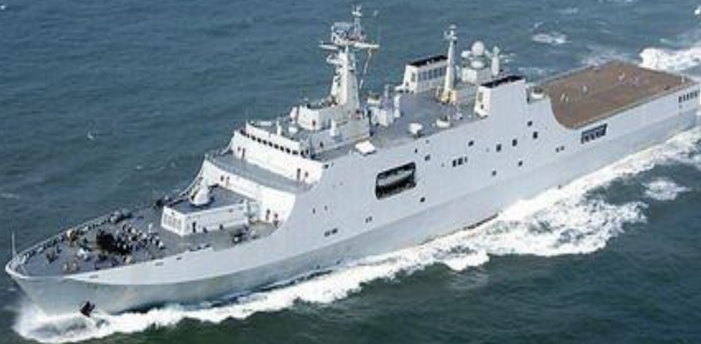
071型综合登陆舰998昆仑山号

Sẽ vượt sóng ra khơi Cũng cầm chắc cây súng