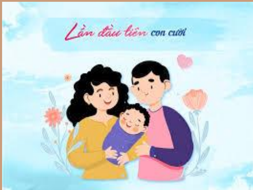
Em bé, cha, mẹ