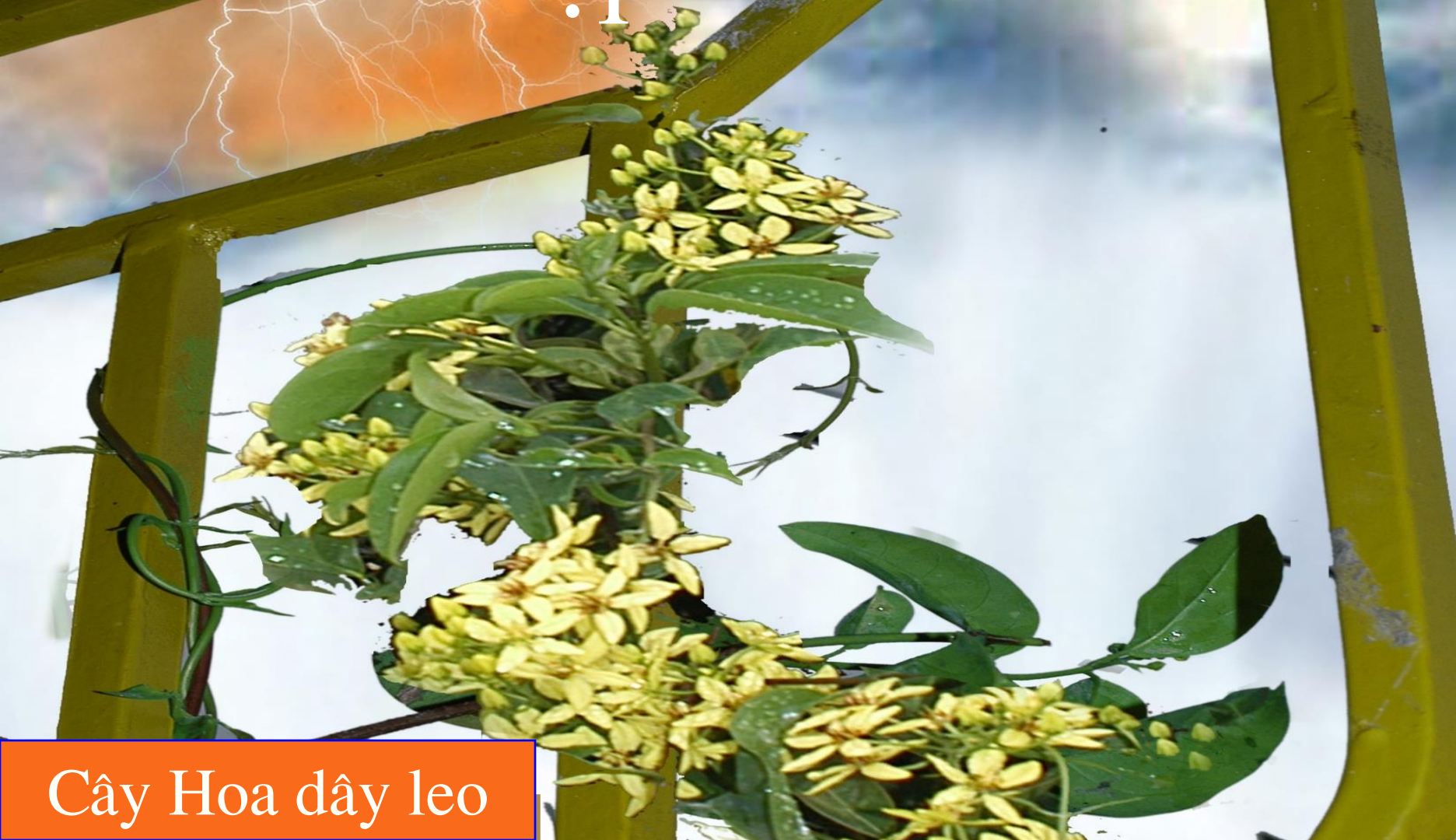
Cây Hoa dây leo