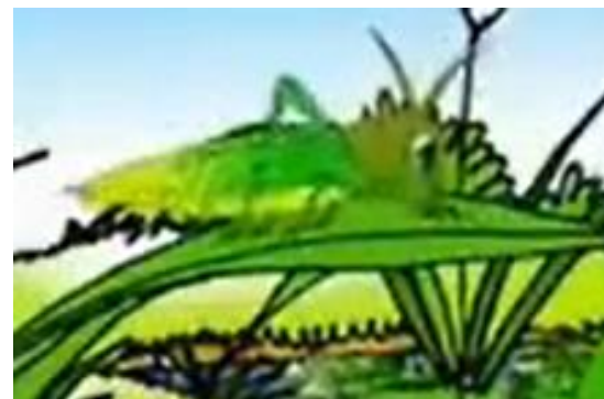
Anh Châu Chấu thay áo anh khi nhảy trên bãi cỏ, áo nâu khi nhảy trên bãi đất.