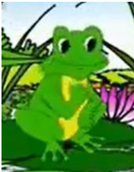
Bạn Nhái Bén thay áo xanh ánh như cây cỏ