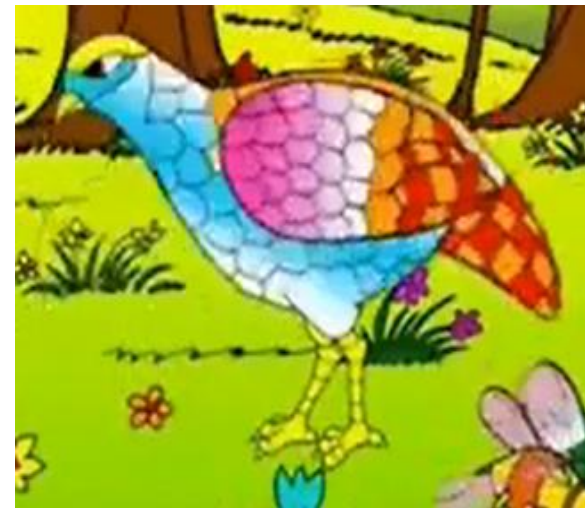
Cô Gà Gô