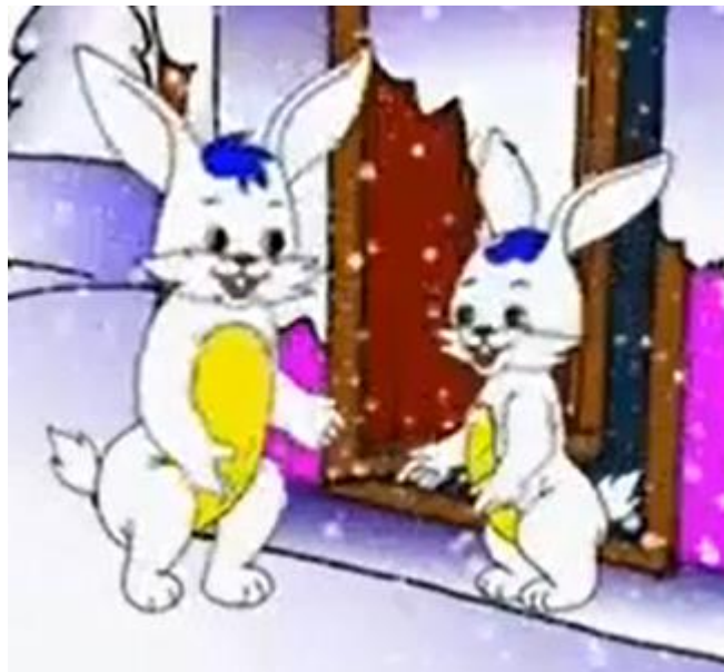
Thỏ mẹ, thỏ con