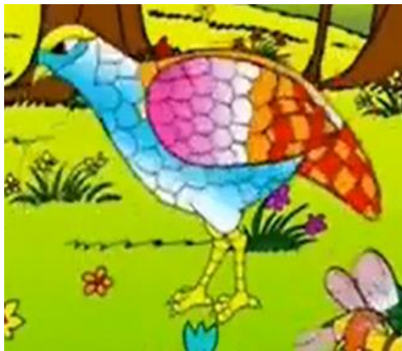
Cô Gà Gô thay áo hoa

Mùa xuân đến trong rừng ai đã thay áo mới?