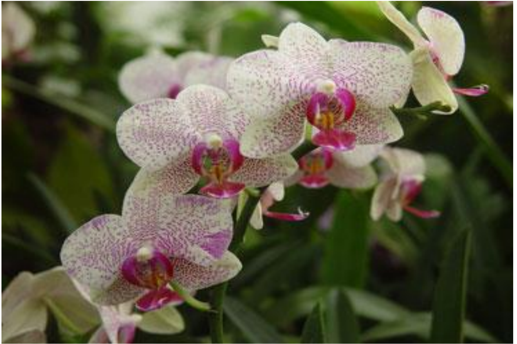
hoa phong lan