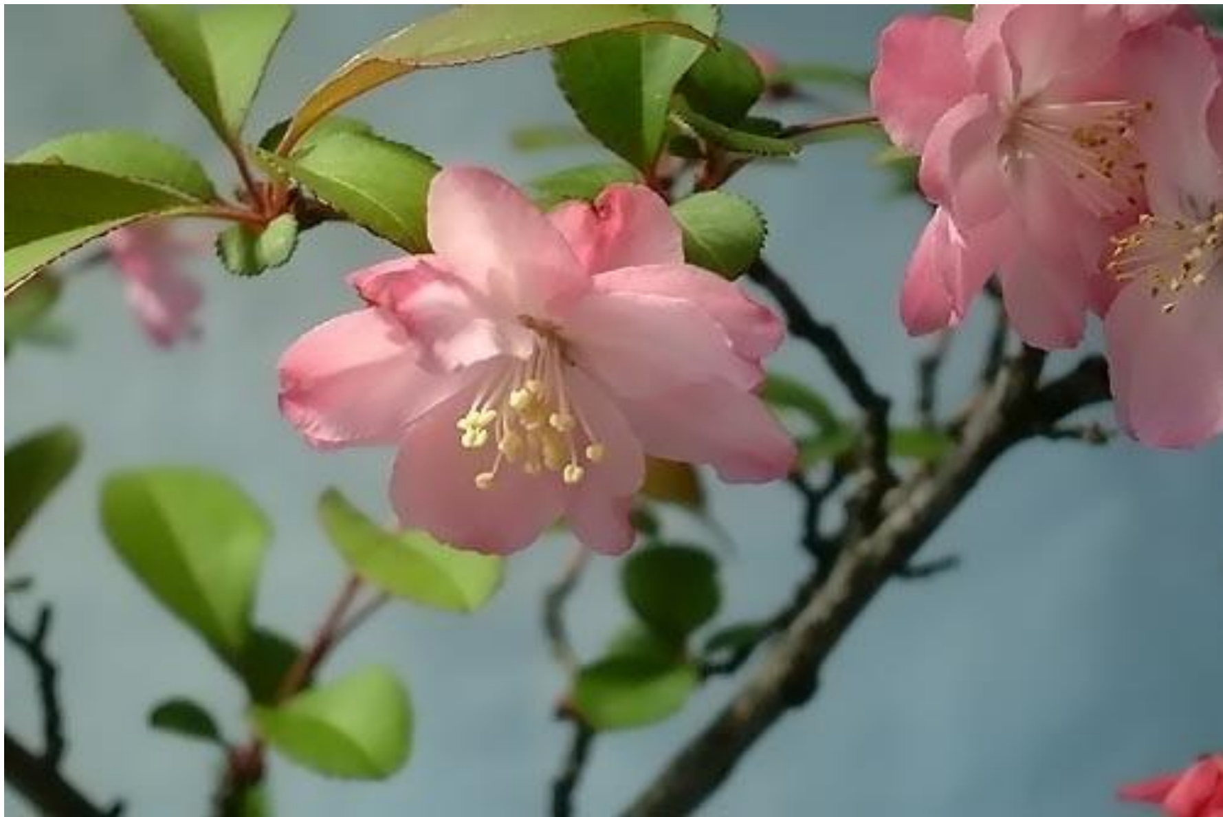
hoa nguyệt quế