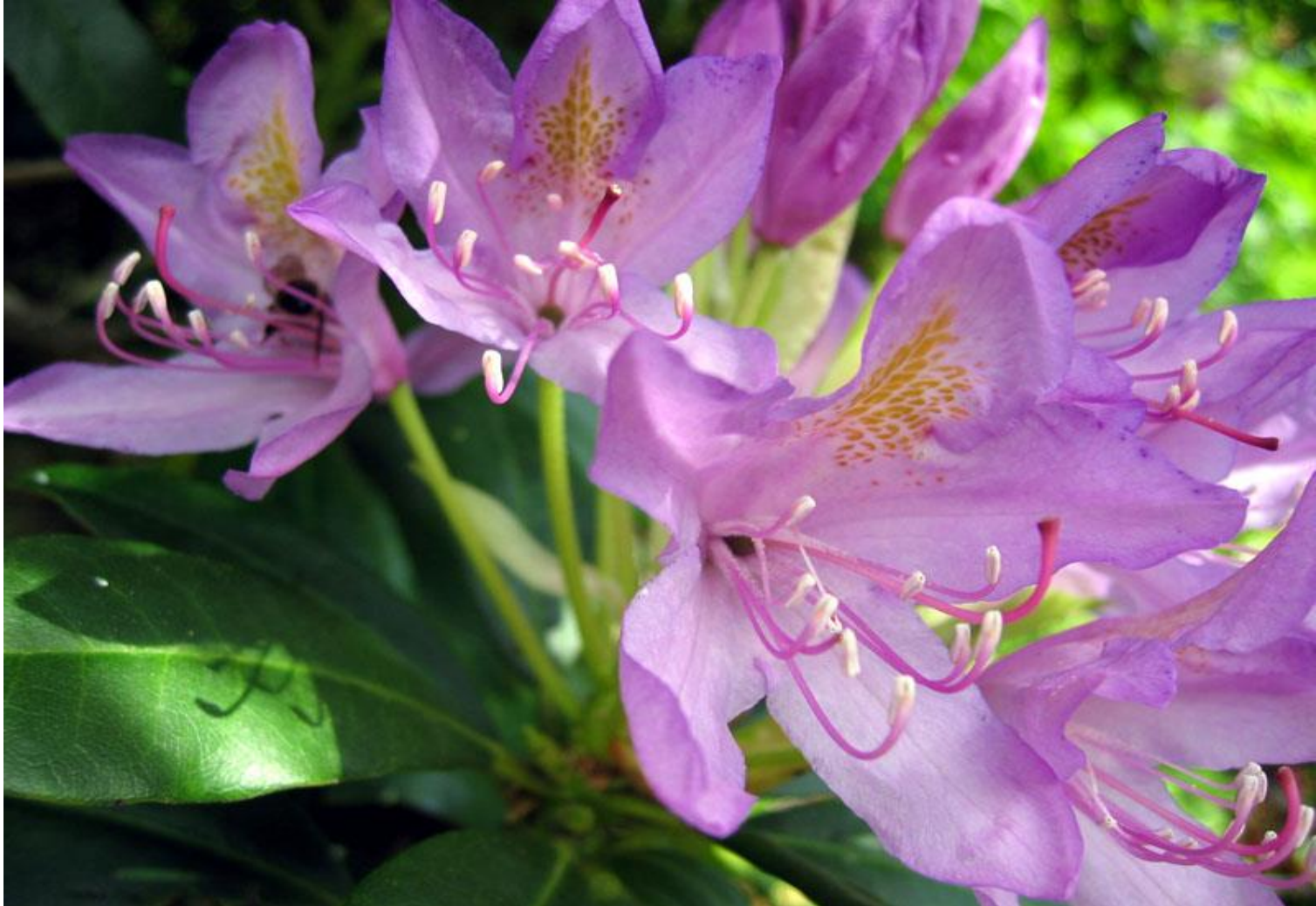
hoa đỗ quyên

* Hoat đông 6 : Trò chơi : tìm chữ cái p, q trong tên hoa