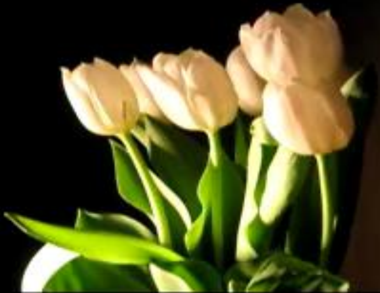
hoa tuy líp