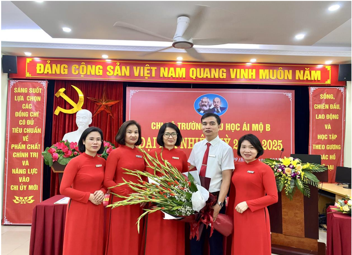
Cô được tín nhiệm bầu vào Cấp ủy Chi bộ trong Đại hội Chi bộ trường