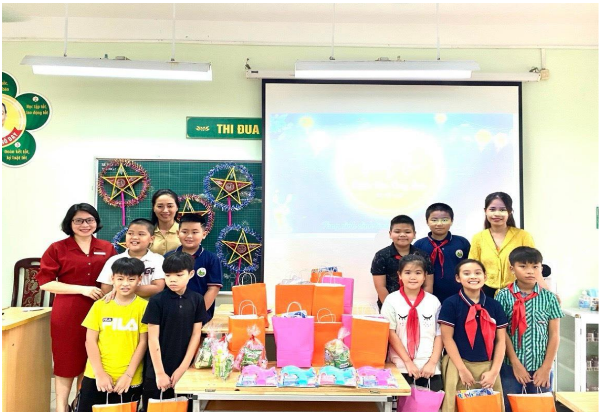
Hoạt động phong trào của lớp cô chủ nhiệm