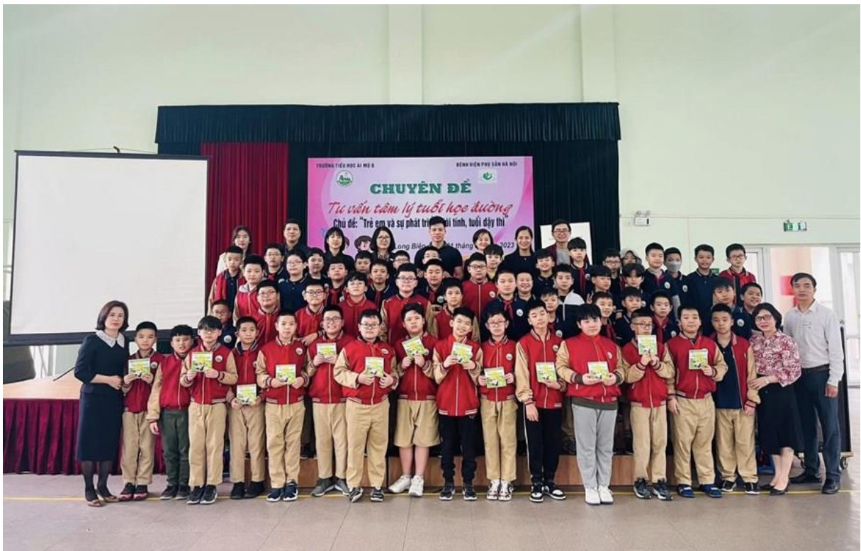
Cô tham gia Chuyên đề Tư vấn tâm lý tuổi học đường tại trường