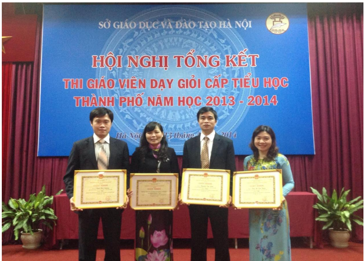
Cô Tuyên cùng lãnh đạo PGD&ĐT quận Long Biên và đồng nghiệp nhận bằng khen Giáo viên dạy giỏi cấp Thành phố