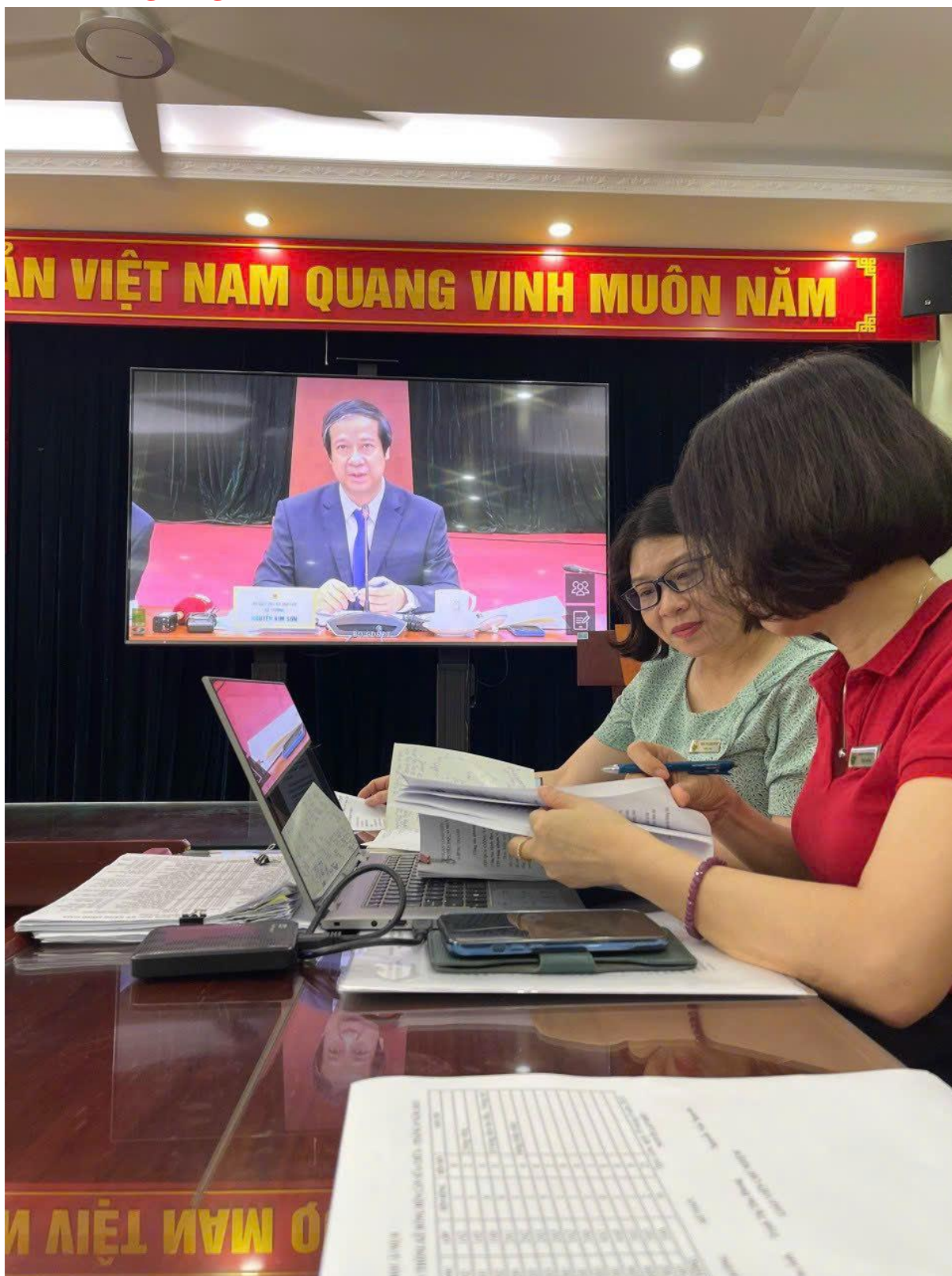
Cô Tuyên trao đổi chuyên môn về thay sách giáo khoa lớp 4