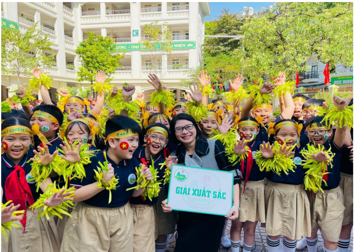
Niềm vui của cô và trò khi nhận Giải Xuất sắc