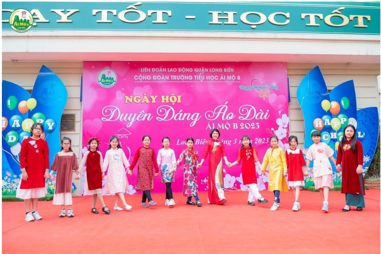
Cô cùng học sinh tham gia biểu diễn trang phục áo dài