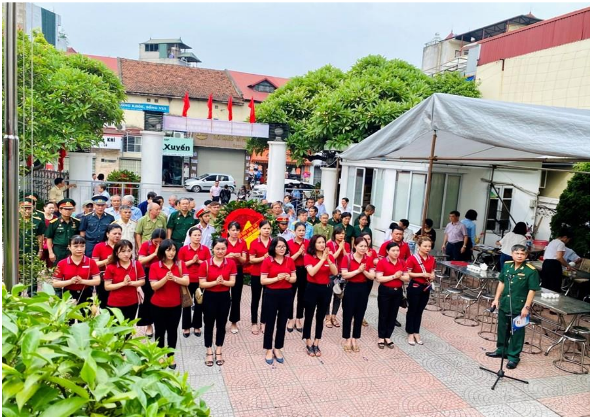
Cùng đồng nghiệp viếng Đài tưởng niệm anh hùng liệt sĩ phường Ngọc Lâm