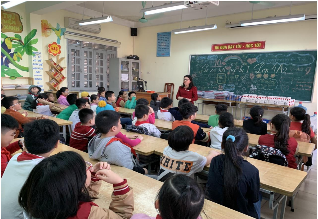
Cô cùng học sinh trong Lễ Sơ kết cuối Học kỳ I