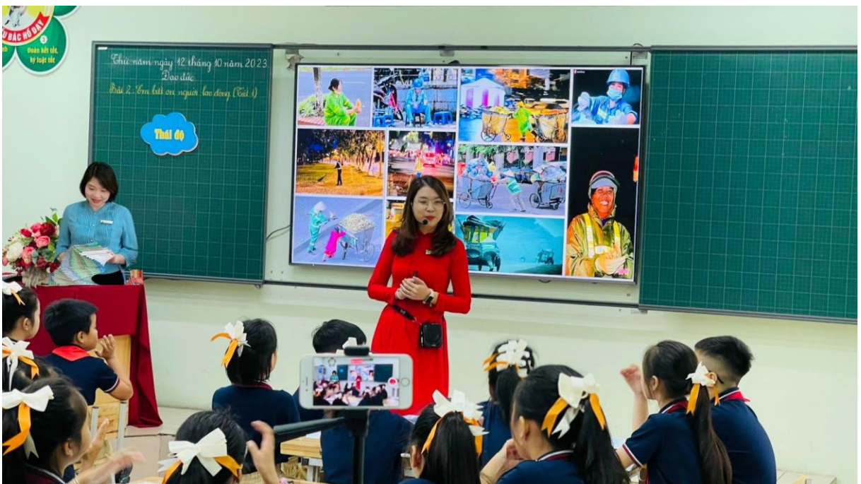
Cô Tuyền cùng tổ chuyên môn tham gia hướng dẫn, xây dựng tiết dạy chuyên đề cấp Quận cho giáo viên trong khối