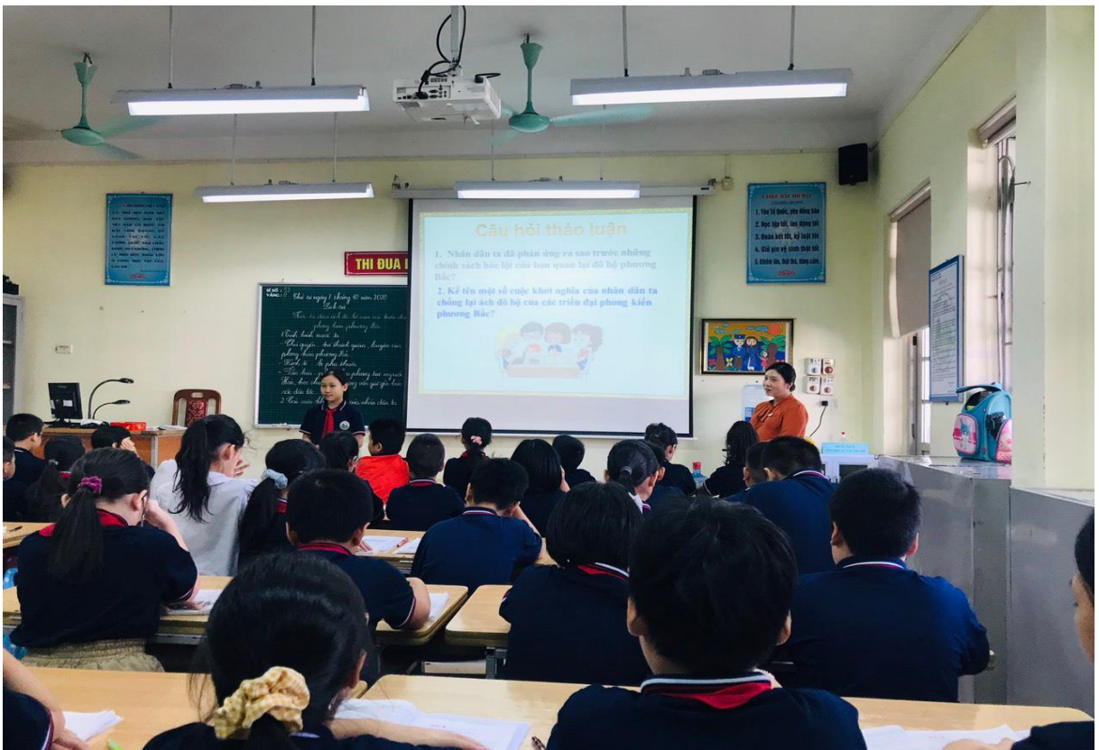
Học sinh hăng hái, tập trung trong giờ học cô dạy.