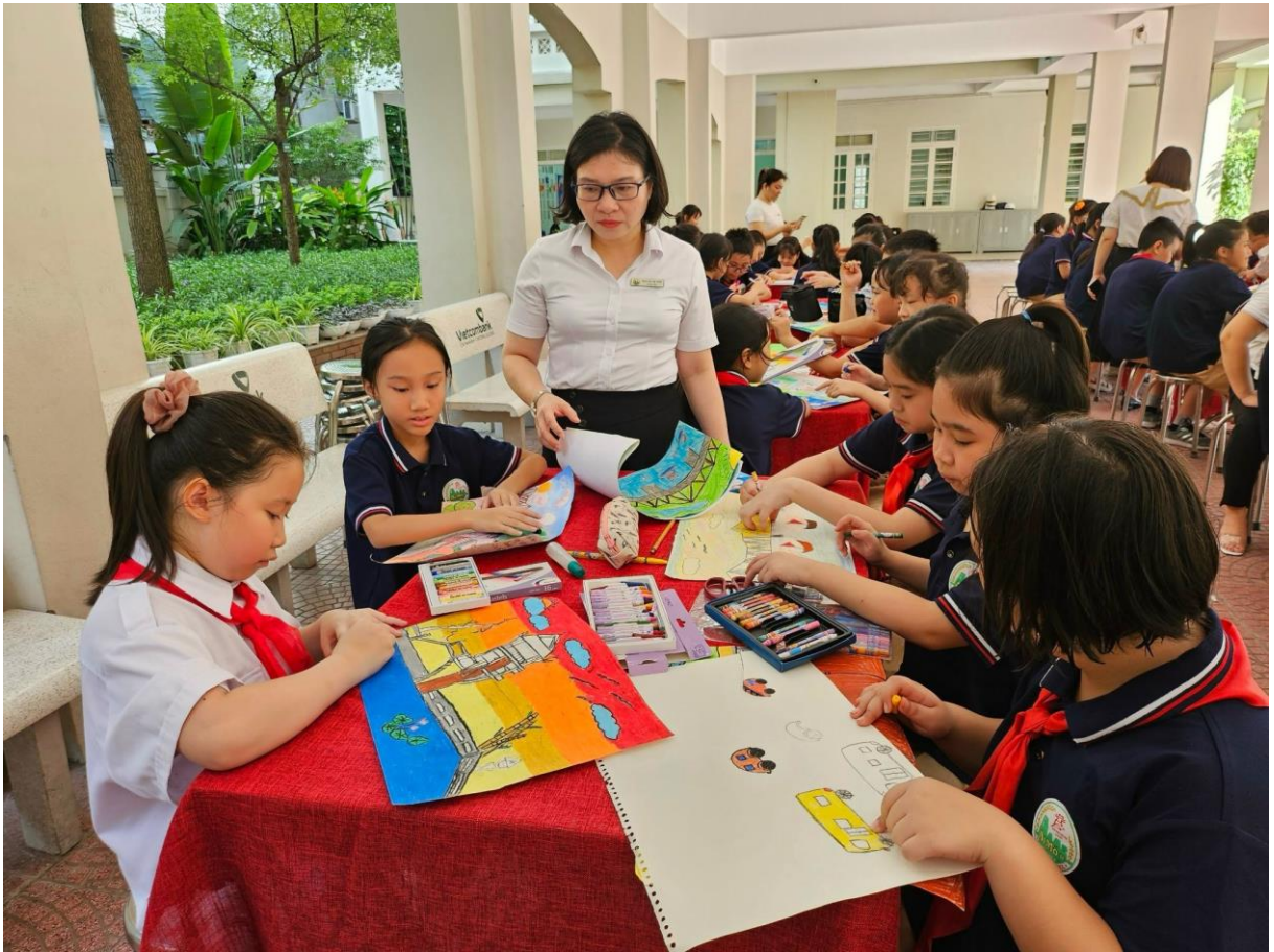
Cô Tuyền hướng dẫn học sinh vẽ tranh chào mừng 20 năm ngày thành lập quận Long Biên