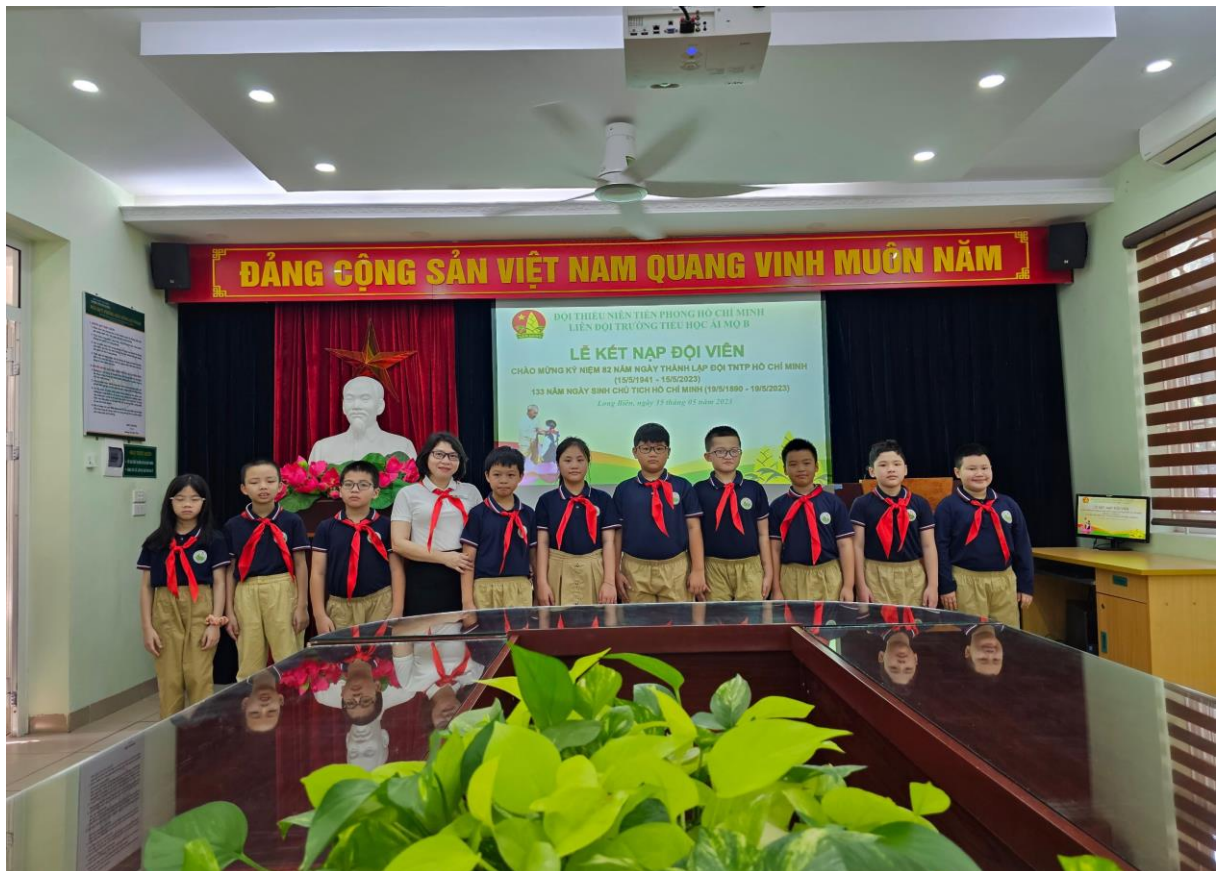
Cô chụp ảnh kỉ niệm cùng đội viên mới của lớp trong Lễ kết nạp đội viên