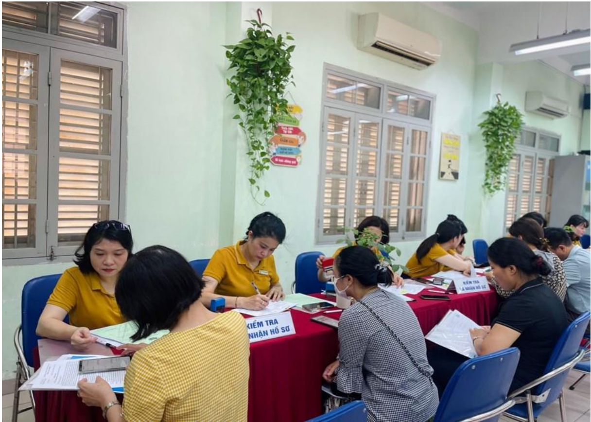
Cô hướng dẫn CMHS kích hoạt ứng dụng VNeID mức độ 2 trong buổi tuyển sinh lớp 1