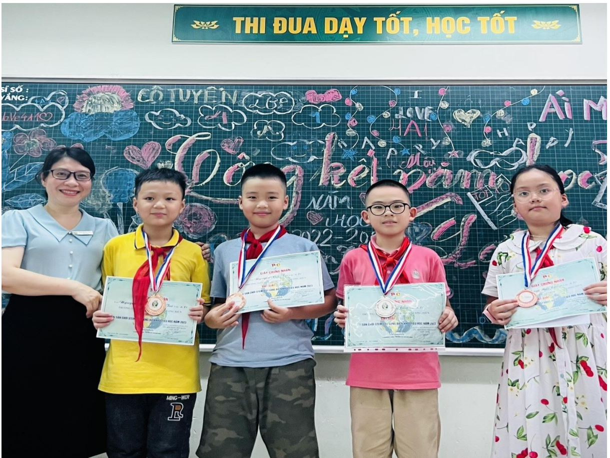
Cô trao thưởng cho học sinh của lớp đạt giải cao ở Cuộc thi các cấp