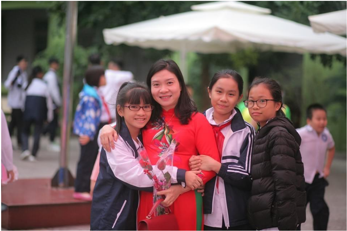
Học sinh cũ về thăm và tri ân cô nhân ngày Nhà giáo Việt Nam 20/11