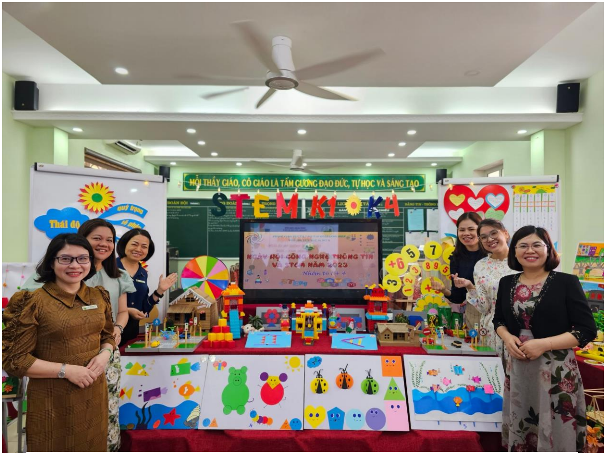
Cô Tuyền cùng đồng nghiệp với sản phẩm trong ngày hội CNTT 2023