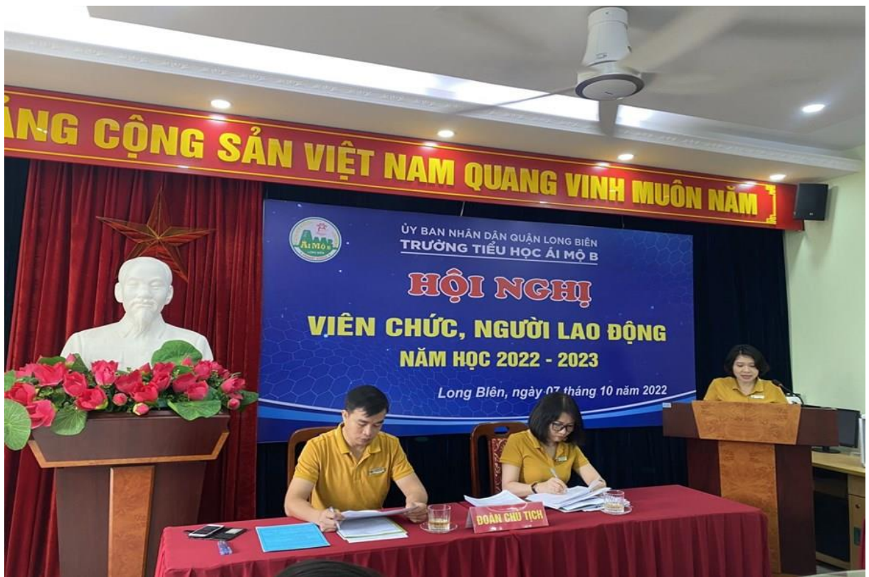
Cô Tuyền trong Hội nghị viên chức, người lao động