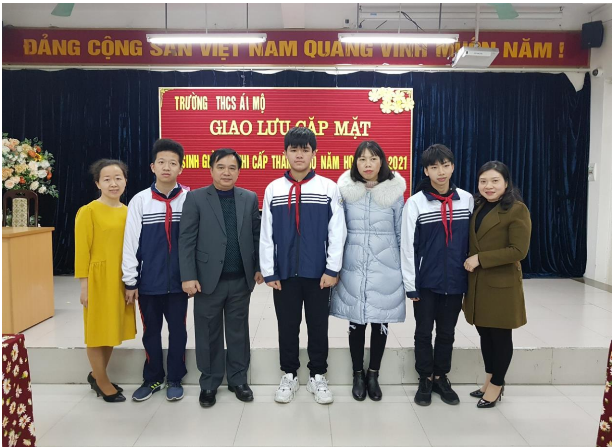
Cô Tuyên và con trai trong buổi Giao lưu Học sinh Giỏi thi cấp Thành phố