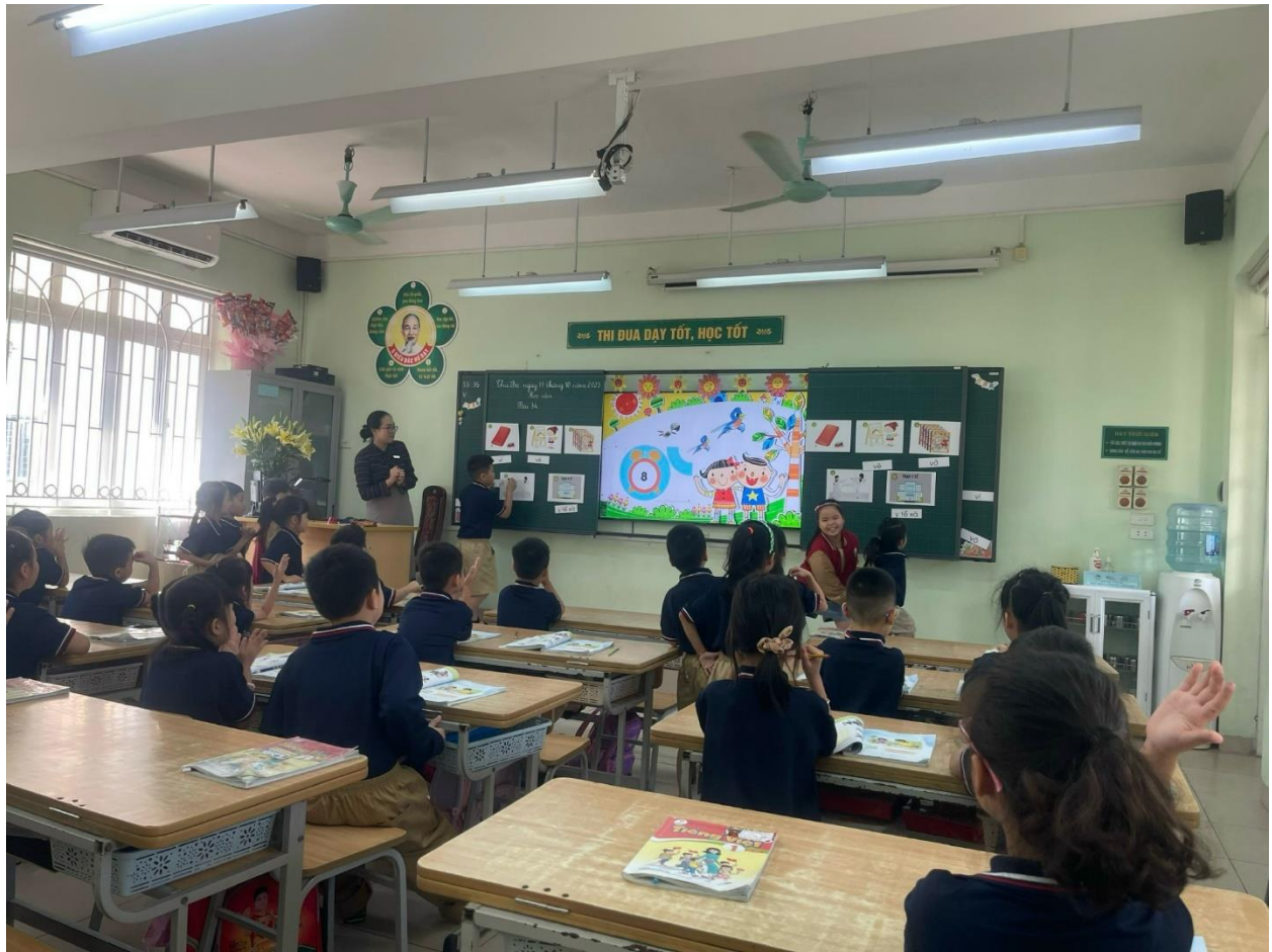
Tác giả: Vũ Kim Ngân