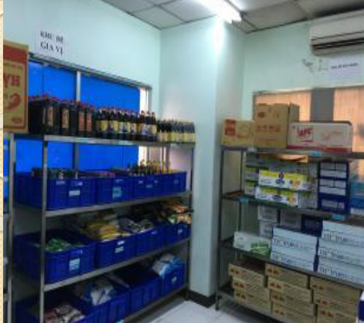
Có giá kệ kê cao thực phẩm