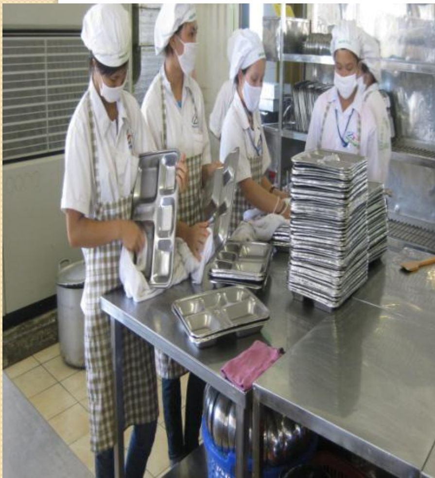
Dụng cụ đựng suất ăn bằng Inox