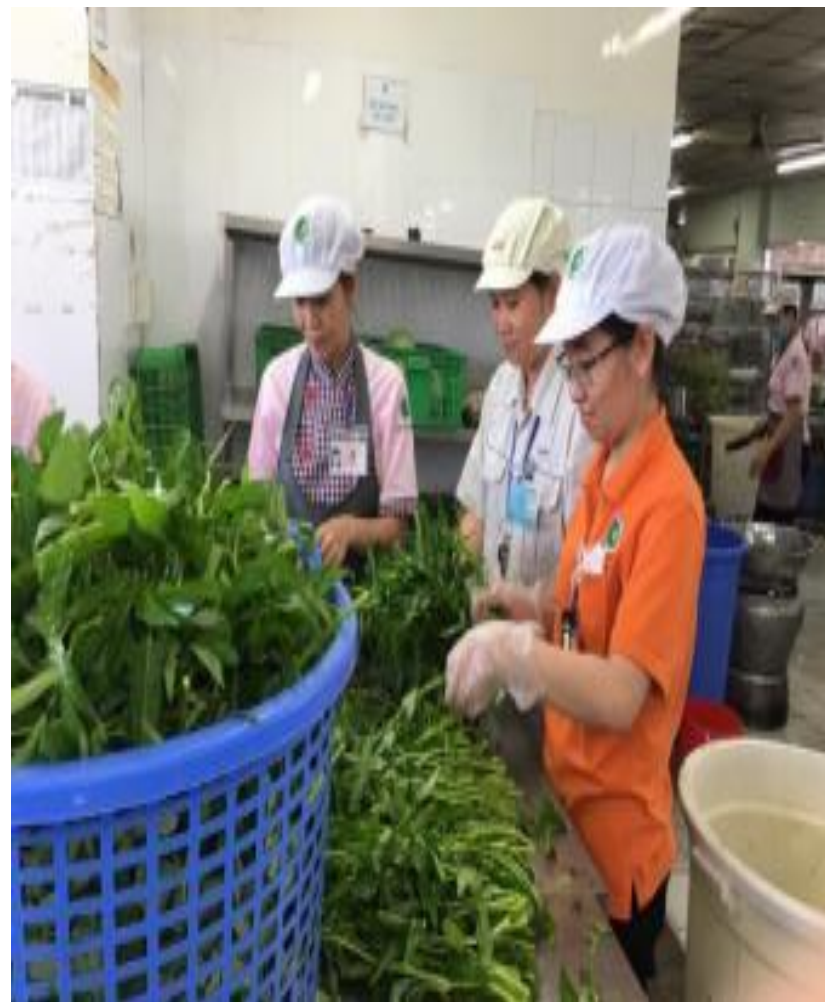
Có bàn cao để sơ chế, chế biến thực phẩm