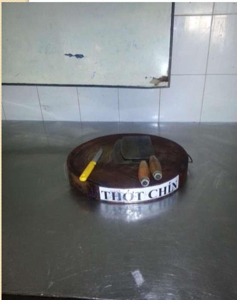
Dao thớt sống – chín riêng