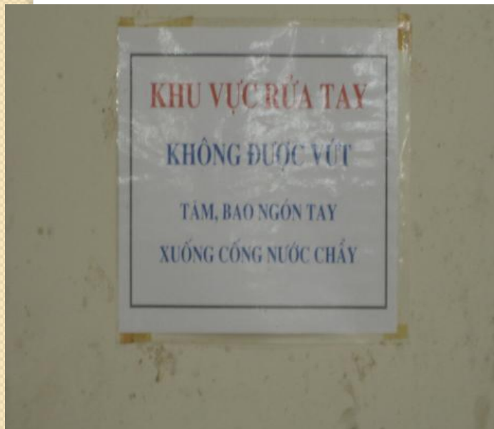
Có khu vực rửa tay