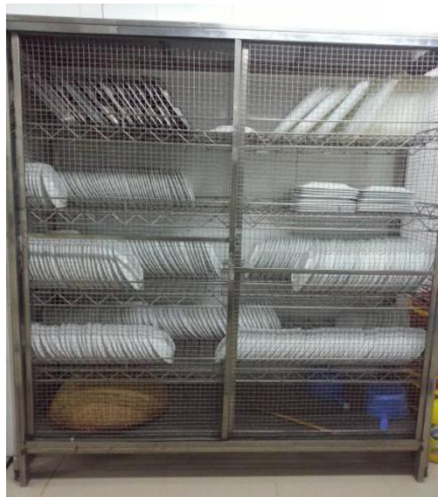
Tủ bảo quản dụng cụ có lưới phòng chống côn trùng