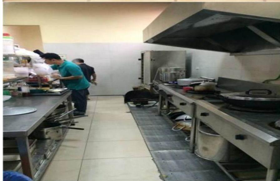
Hệ thống cống rãnh kín, khai thông thường xuyên