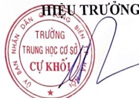
Lê Thị Hồng Thái