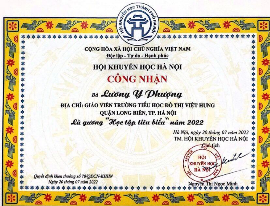
Công nhận của Hội Khuyến học Hà Nội là gương "Học tập tiêu biểu" năm 2022