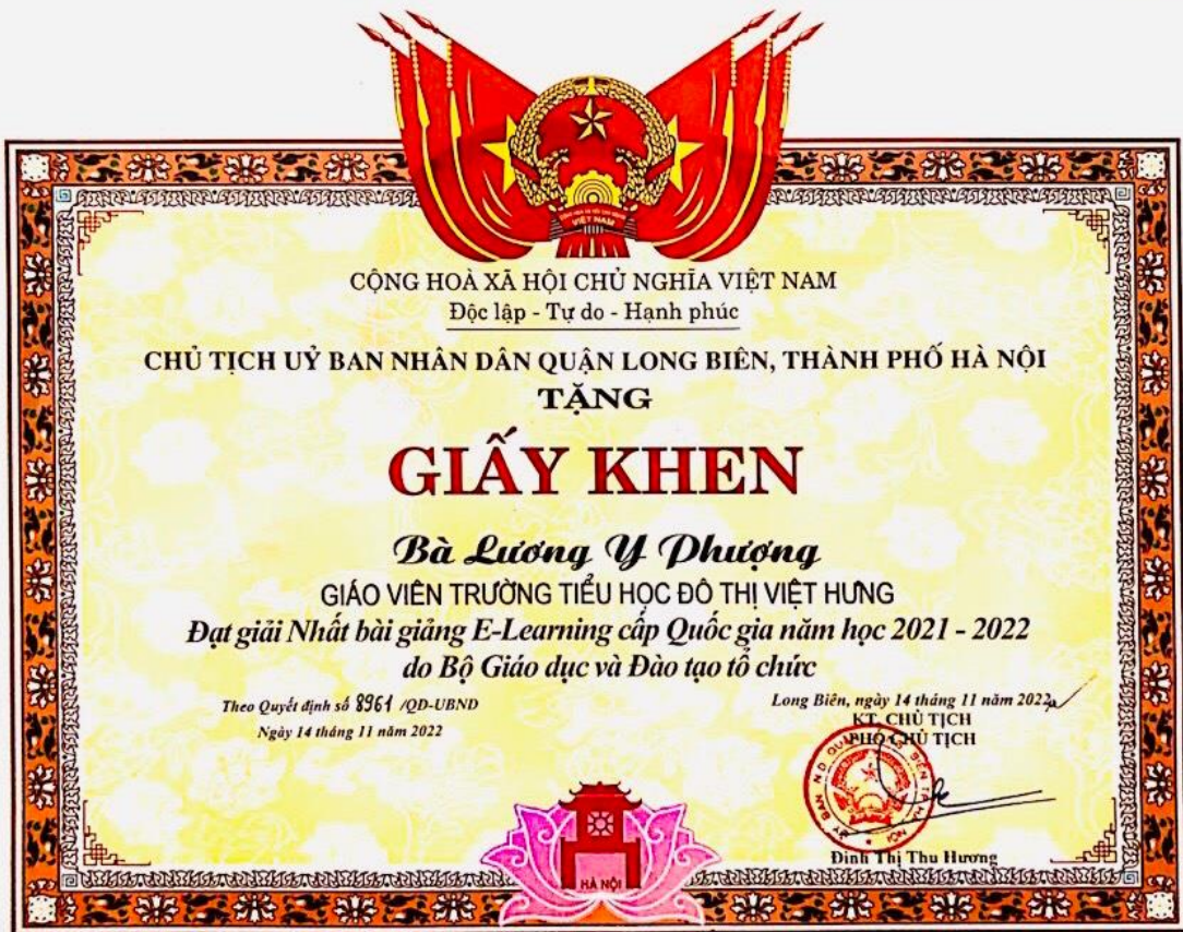
Giấy khen của Chủ tịch UBND Quận Long Biên tặng giáo viên đạt giải Nhất bài giảng E-learning cấp Quốc gia năm học 2021-2022