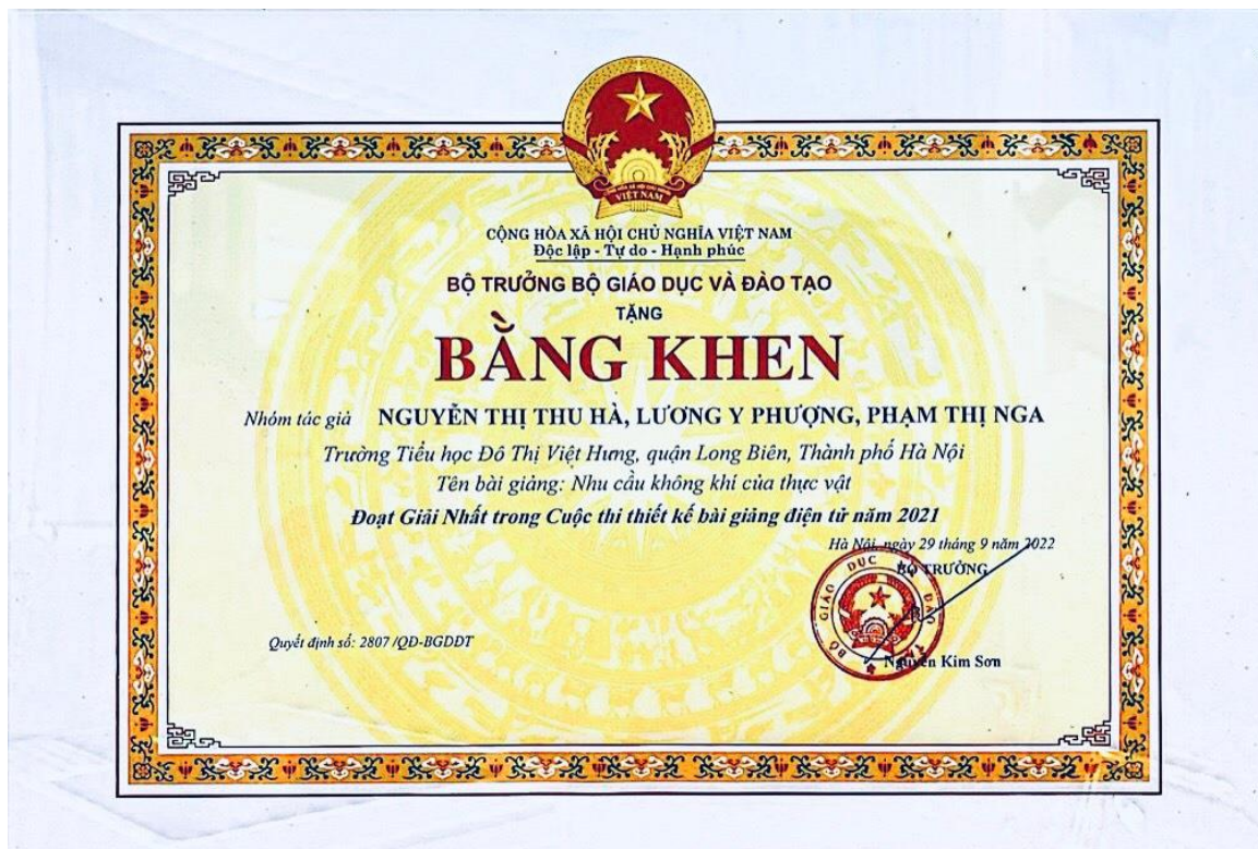
Bằng khen của Bộ GD&ĐT đạt giải Nhất cấp Quốc gia trong cuộc thi thiết kế bài giảng điện tử năm 2021