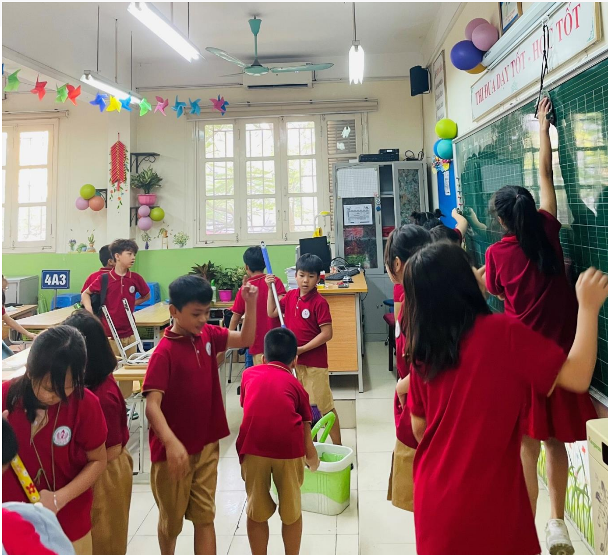
Hình ảnh: Lớp 4A3 tham gia lao động vệ sinh cuối tuần

Trường Tiểu học Giang Biên đã thực hiện việc tổ chức hoạt động dọn vệ sinh hàng tuần vào thứ 6 cuối tuần và đây đã trở thành một phần không thể thiếu trong lịch trình giáo dục của học sinh tại trường. Mục tiêu chính của hoạt động này là giáo dục ý thức môi trường cho học sinh, tạo sự đoàn kết trong cộng đồng học sinh, và xây dựng tinh thần tự hào về trường học của mình.