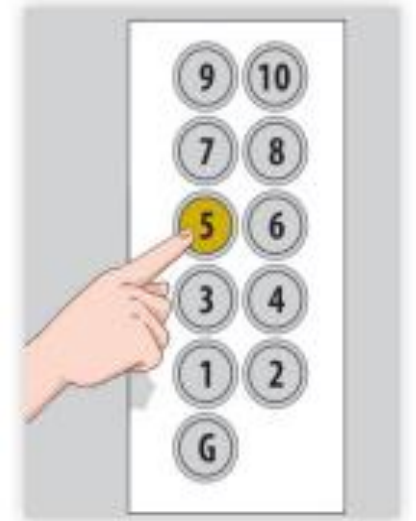
▲ Hình 4.1b