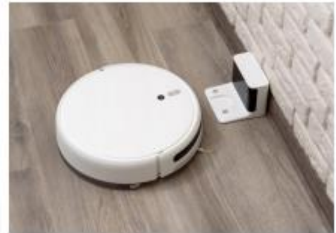
▲ Hình 4.2. Robot lau nhà