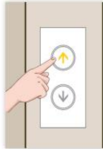
▲ Hình 4.1a

□ Em hãy cùng bạn quan sát hình 4.1a, 4.1b và cho biết: Thang máy nhận được thông tin gì? Kết quả xử lý ra sao?