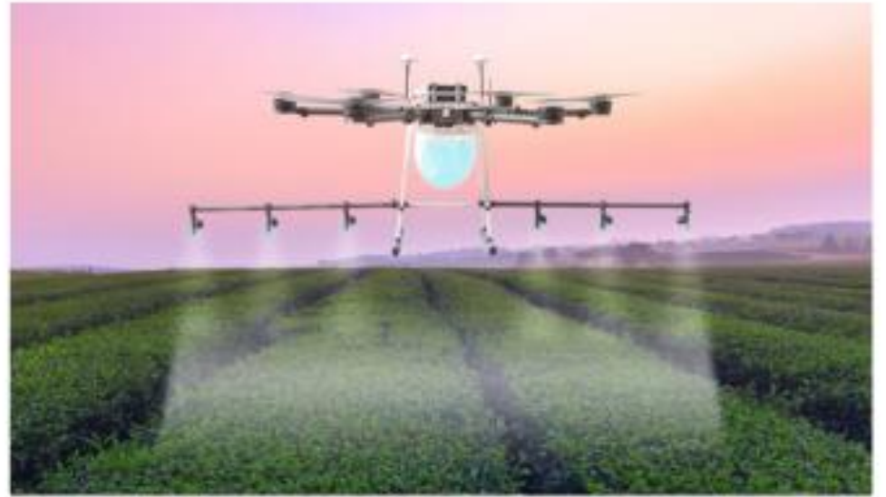
▲ Hình 4.4. Máy bay phun thuốc trừ sâu