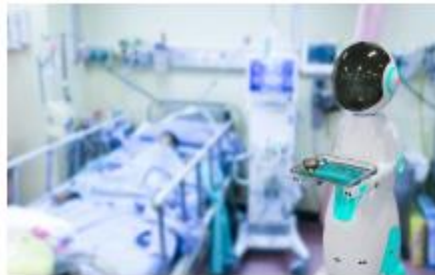
▲ Hình 4.3. Robot trong bệnh viện