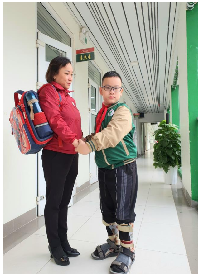
Chị Hương và con trai ngày ngày cùng tới lớp