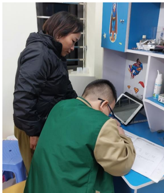
Chị Hương kèm con học ở nhà sau những buổi con đi tập trị liệu