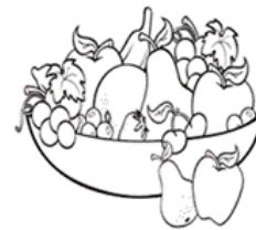
mâm ngũ quả