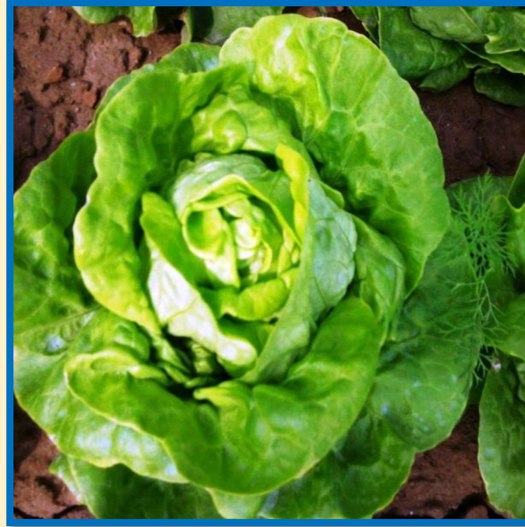
Rau xà lách