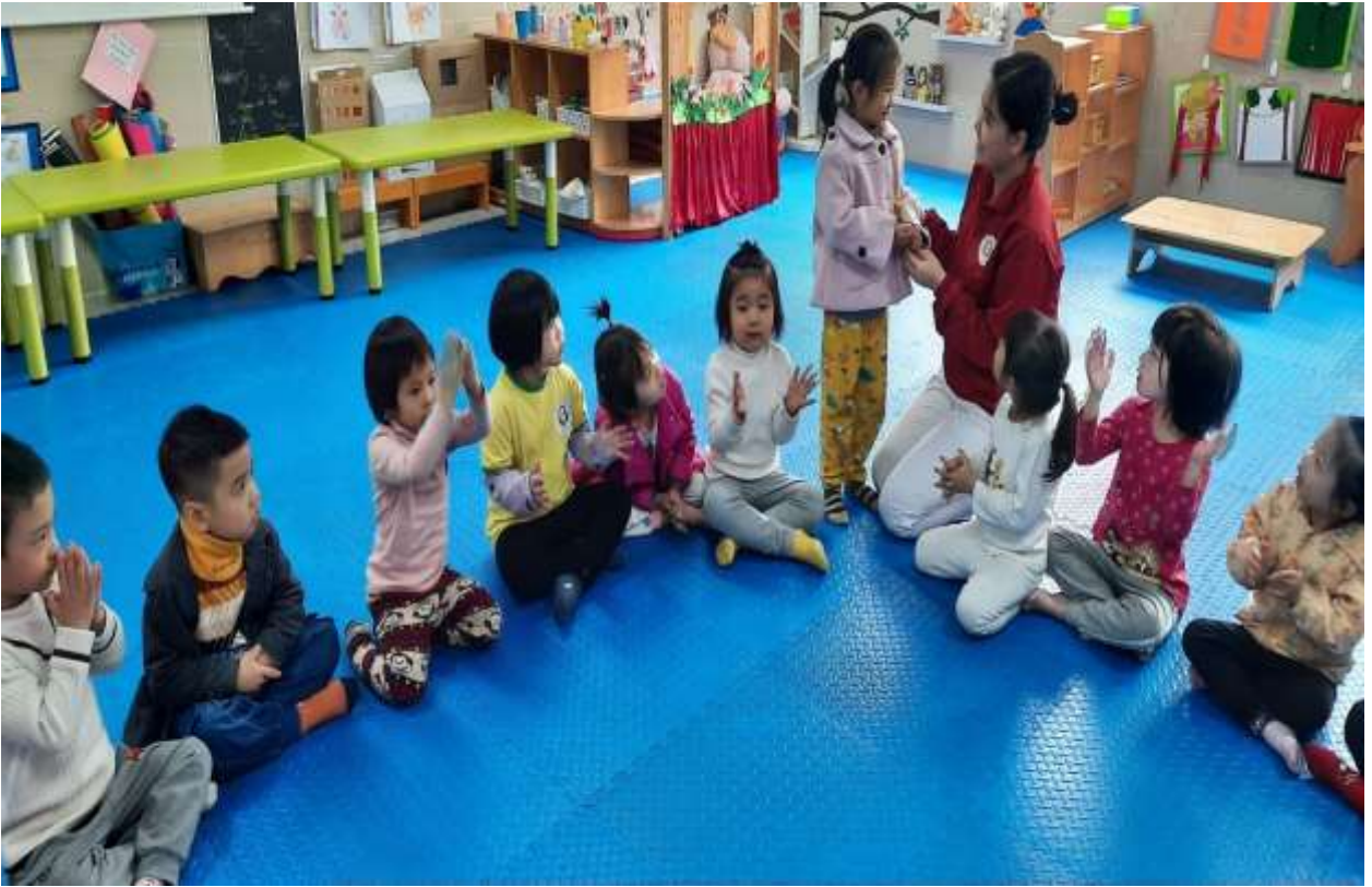
Hình ảnh 7 : Động viên , khen ngợi trẻ