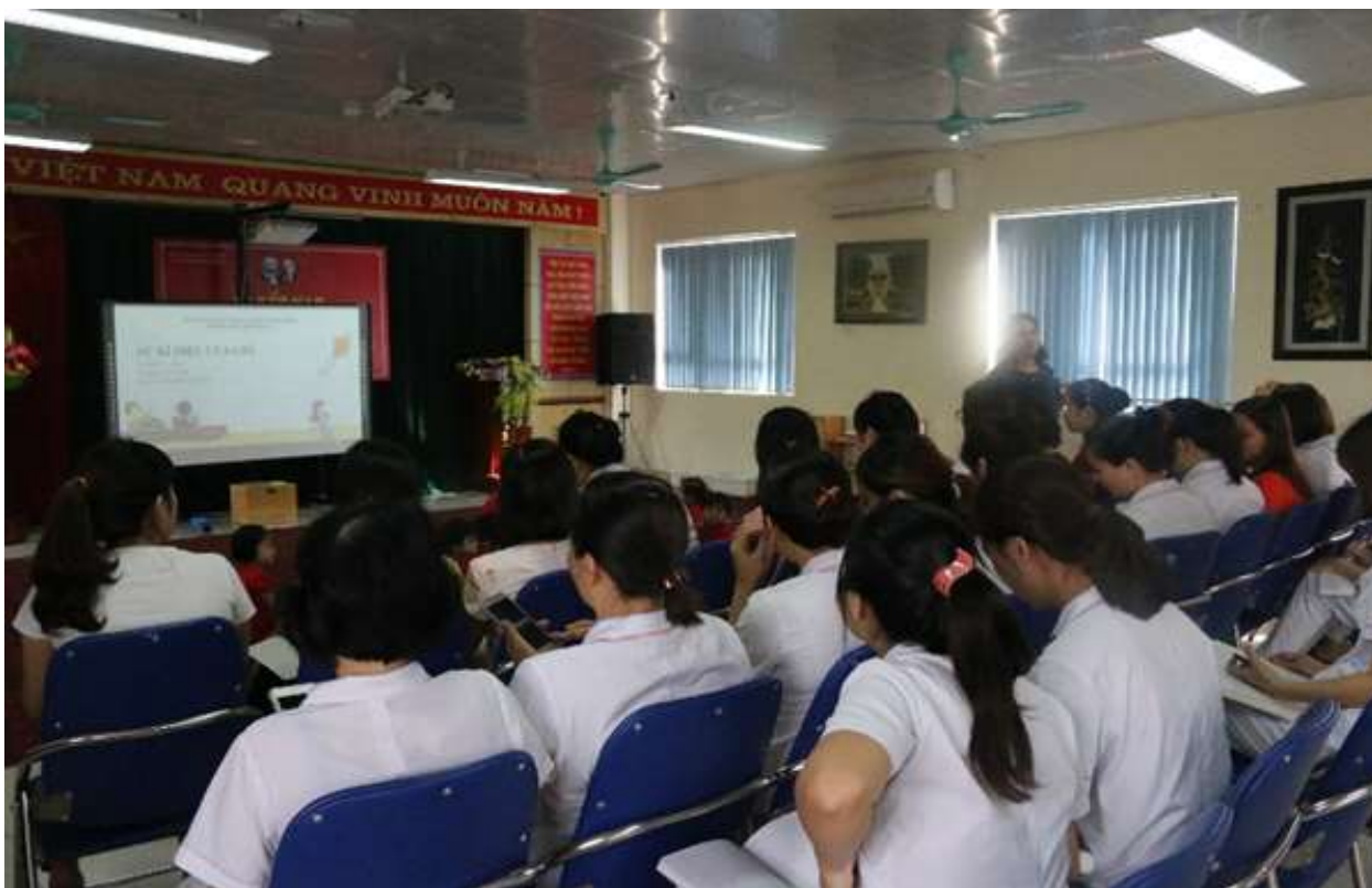
Hình ảnh 1 : Tham gia các buổi trao đổi chuyên môn