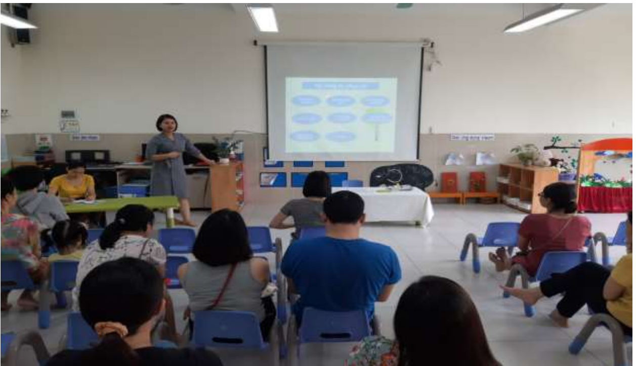
Hình ảnh 8 : Buổi họp phụ huynh đầu năm