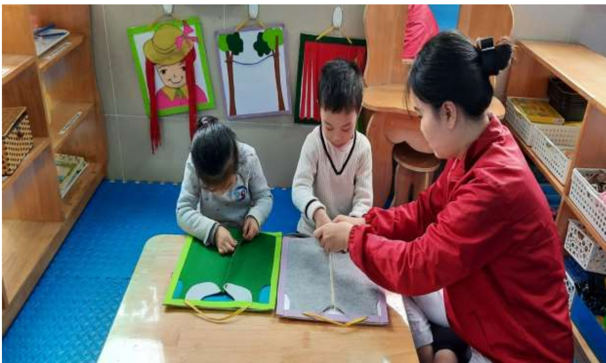
Hình ảnh 2 : Cô hướng dẫn nhẹ nhàng , gần gũi trẻ