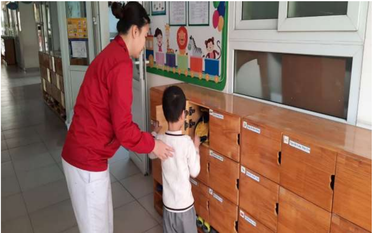
Hình ảnh 3 : Hướng dẫn trẻ cất áo đúng chỗ