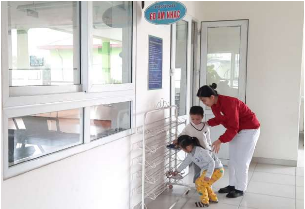
Hình ảnh 5 : Trẻ lên phòng chức năng và cất gọn dép