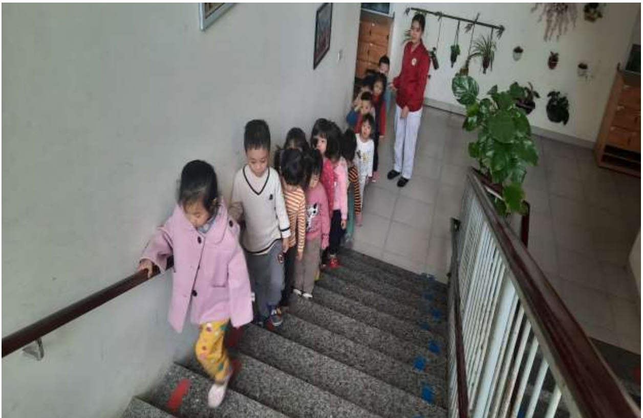
Hình ảnh 4 : Rèn kỹ năng đi cầu thang cho trẻ