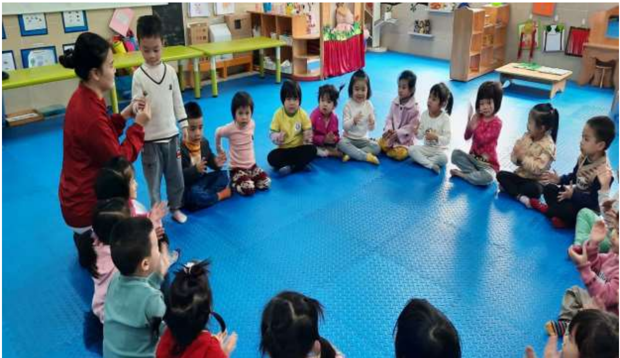
Hình ảnh 6 : Tặng quà khích lệ trẻ